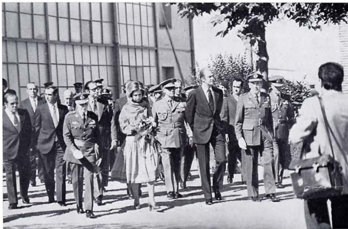
Tras la visita a secciones del Aeródromo, los Reyes y acompañantes se disponen a abandonar el recinto militar.

rojo y esta misma Plaza de Armas fueron el escenario en que se formaron las 4 Promociones de la Academia de Aviación, precursora de la Academia General del Aire de San Javier.