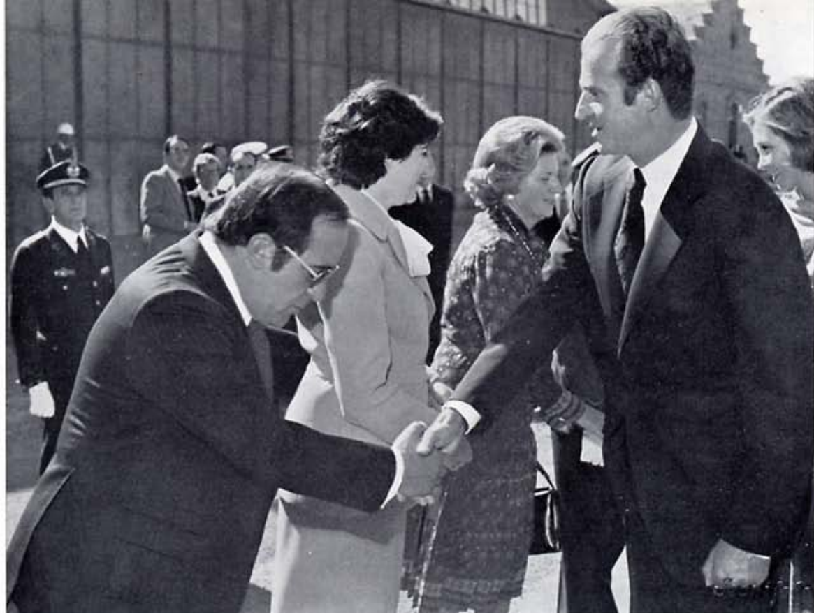
En el Aeródromo de la Virgen del Camino, primeros saludos. Don Juan Carlos estrecha la mano del Presidente de la Diputación leonesa.

Aeródromo de la Virgen del Camino: ante la formación militar del Ejército del Aire, los Reyes firman en el Libro de Honor.