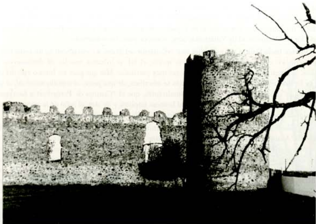
Palacio de los Bazán (Palacios de la Valduerna)