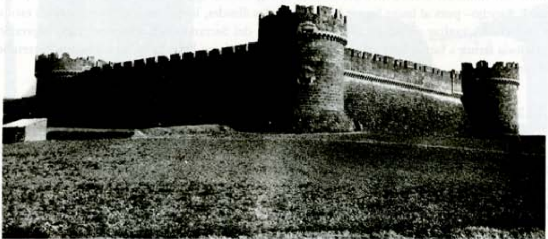
Castillo-Fortaleza de Grajal de Campos