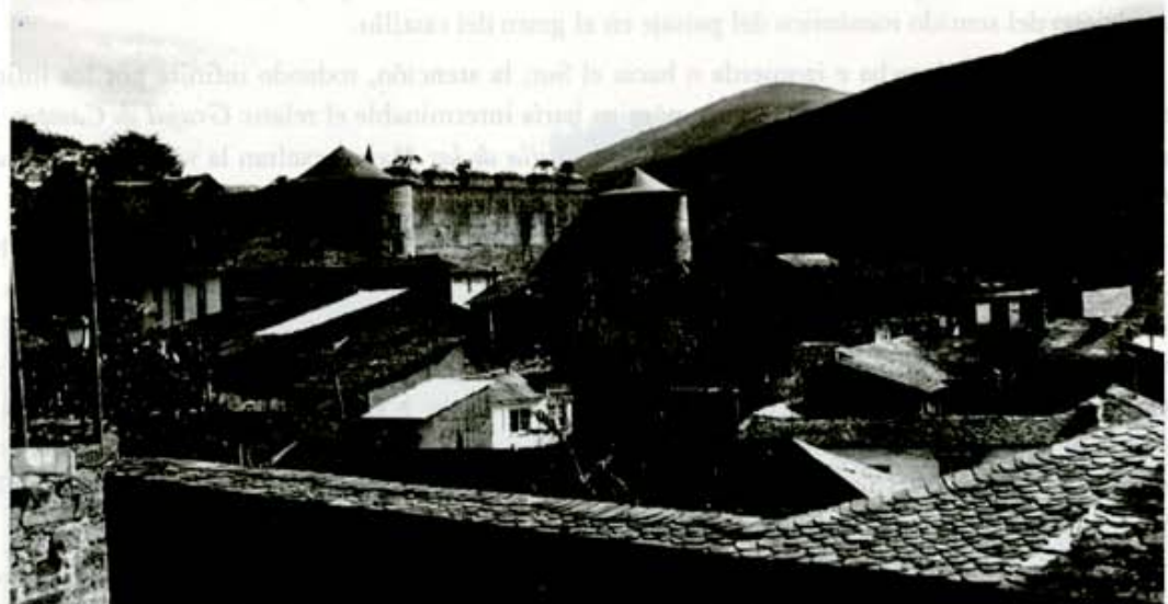
Castillo de los Condes de Peñarramiro, en Villafranca del Bierzo