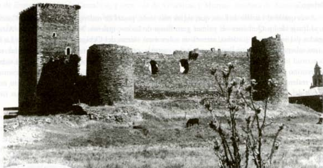
Castillo de Villanueva de Jamuz