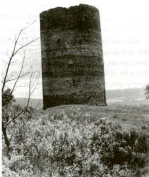
Torre de Ordás