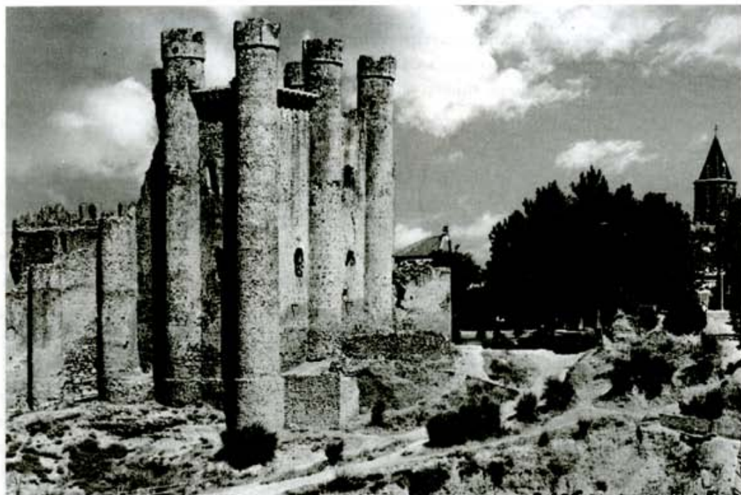
Castillo de Coyanza (S. XIV), con la torre del homenaje