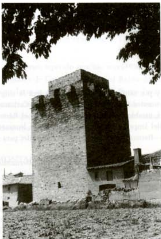
Torre de Quintana del Marco