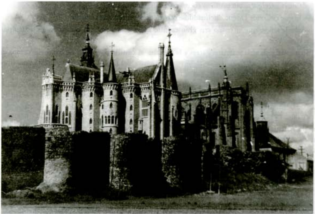
Astorga: Palacio Episcopal, de Gaudí, con las murallas y la Catedral en segundo término