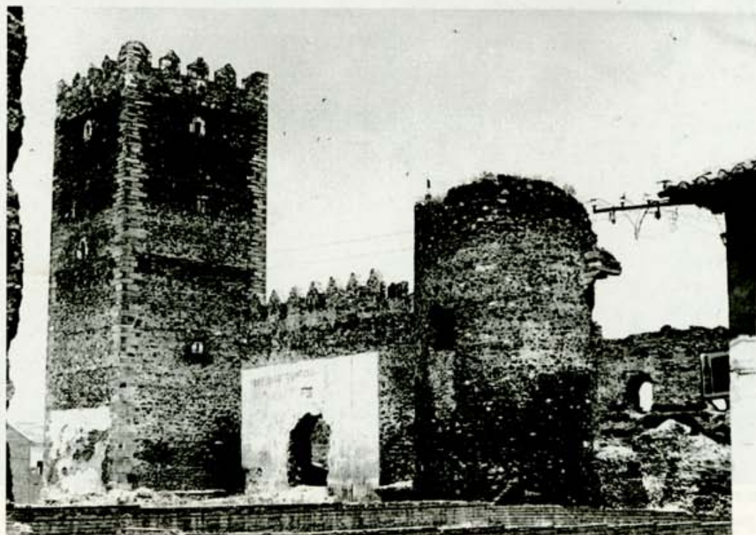
Castillo de Laguna de Negrillos