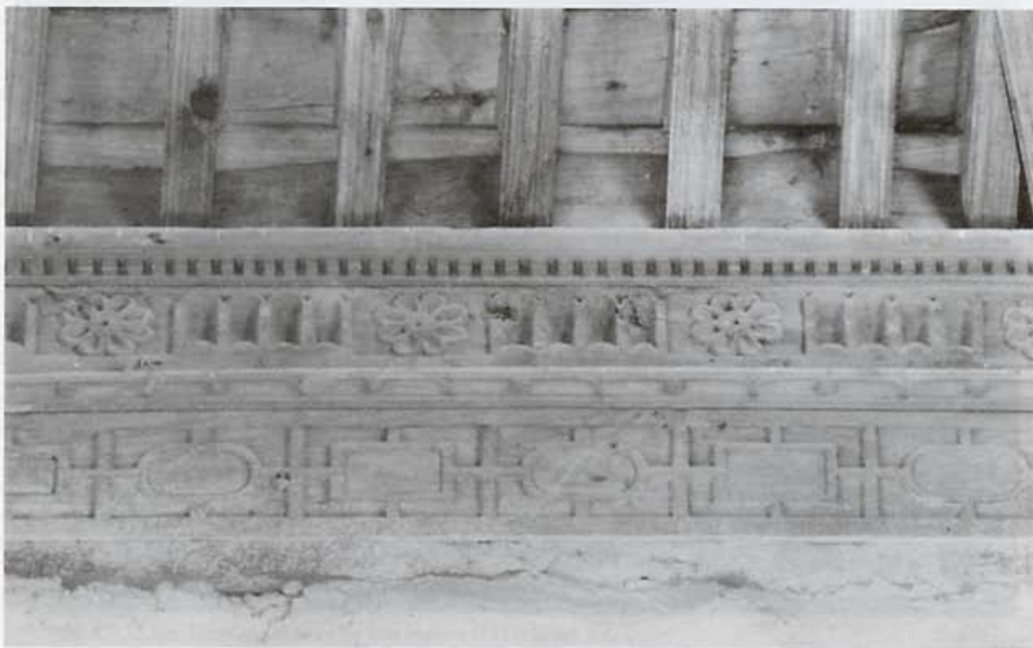
Arrocabe del muro E (detalle).