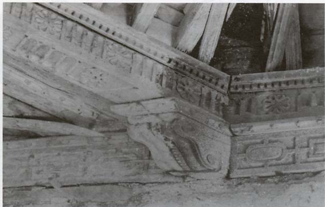
Detalle de uno de los canes del ángulo SE.