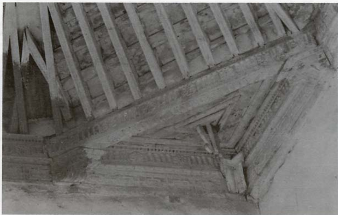
Cuadrante del ángulo SE.