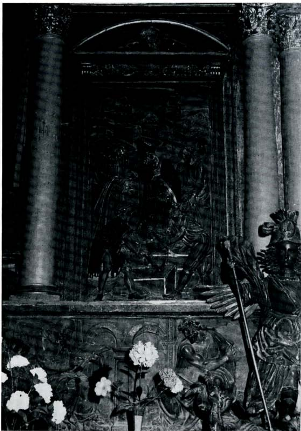
El hallazgo del cuerpo de San Esteban. (Foto: "Benito". Valderas - León).