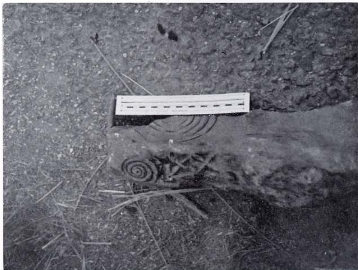
Fragmento de piedra tallada encontrada en la Iglesia Vieya.