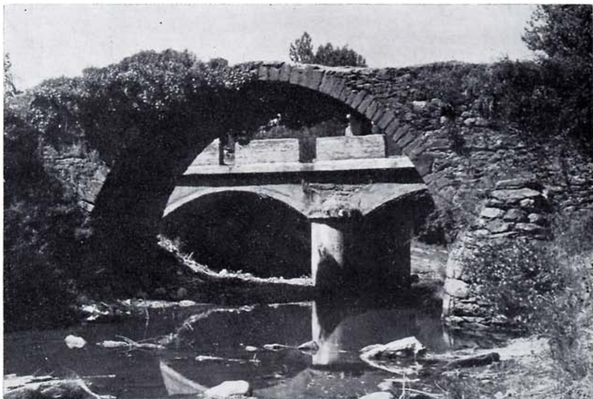
Puente viejo de Truchas en frente de calzada.