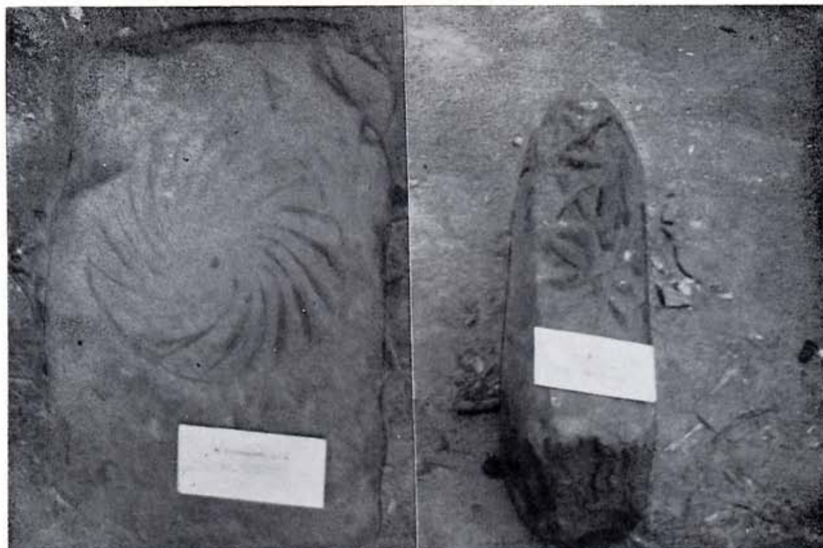
Piedra con relieves procedente de El Palombar.