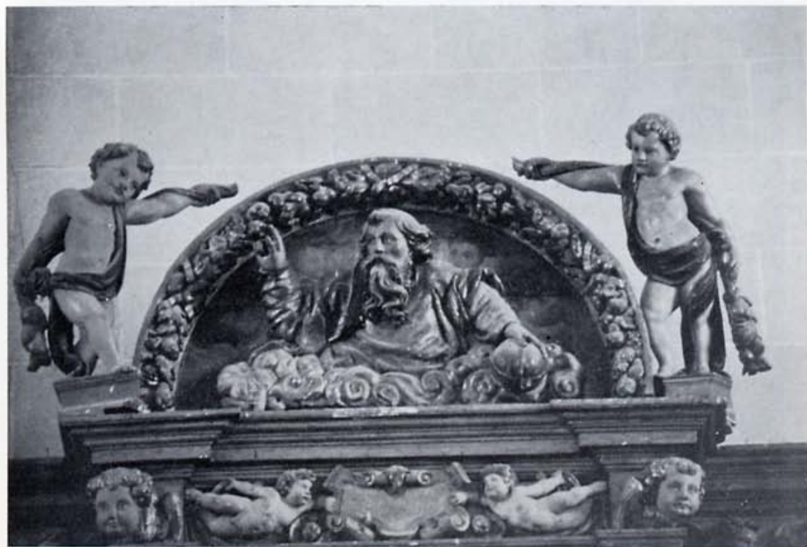
Palanquinos: Padre Eterno.