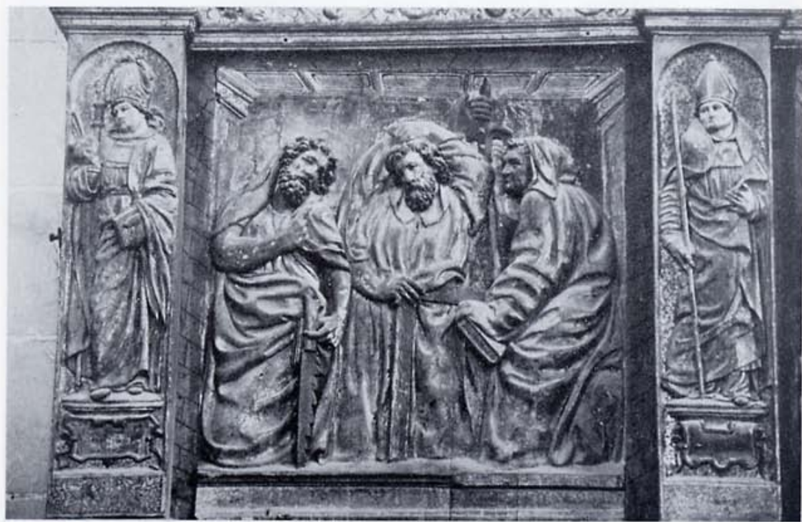
Banco del retablo de Palanquinos: S. Agustín, S. Simón, S. Judas, S. Mateo, S. Ambrosio.