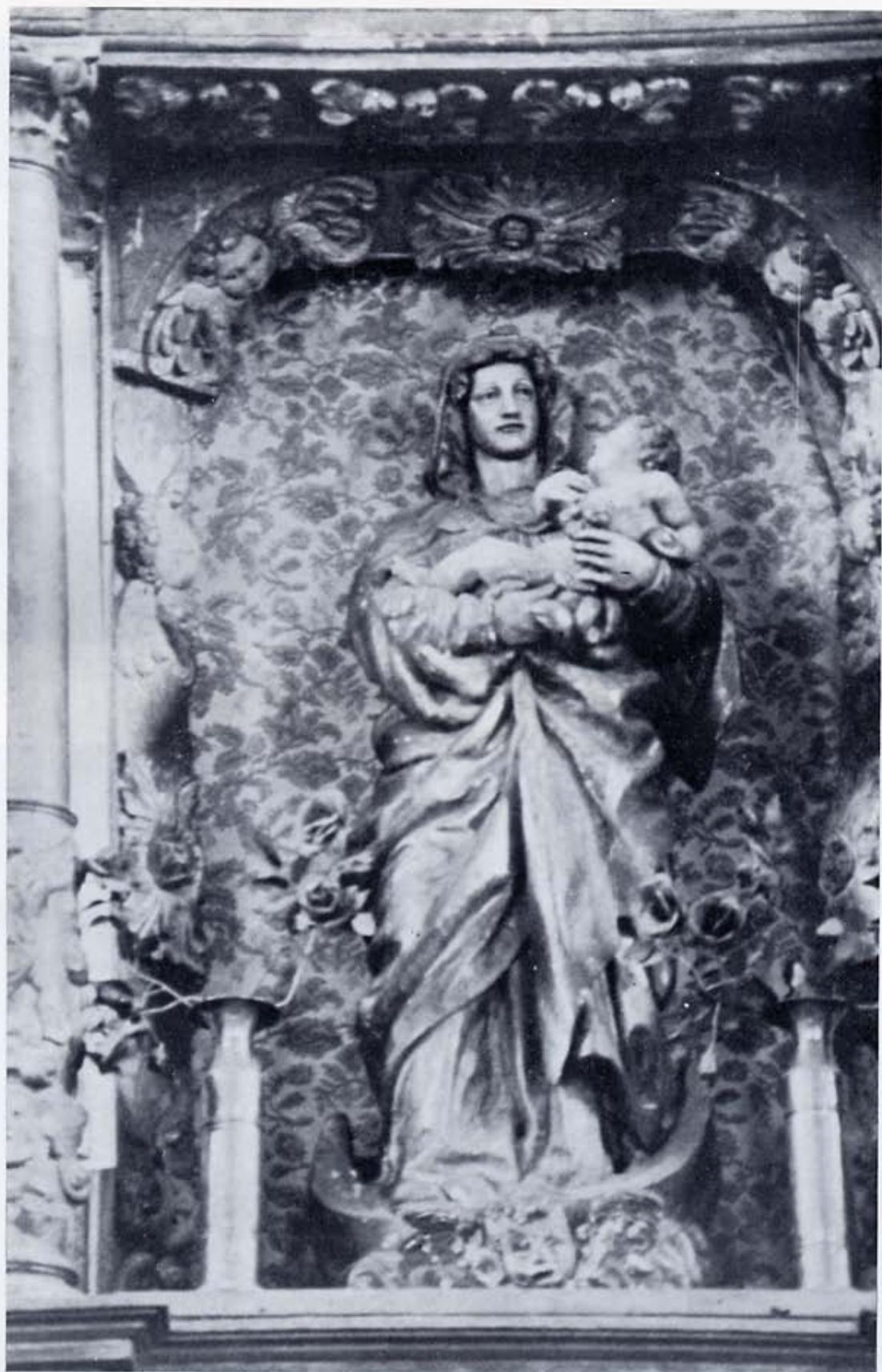
Palanquinos: Virgen de la Flor.