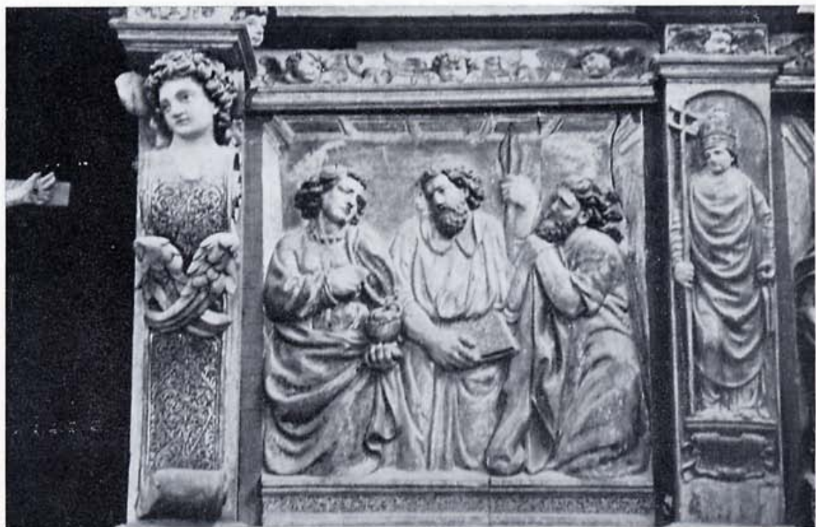
Banco del retablo de Palanquinos: S. Juan, Sto. Tomás, Santiago el Menor, S. Gregorio.