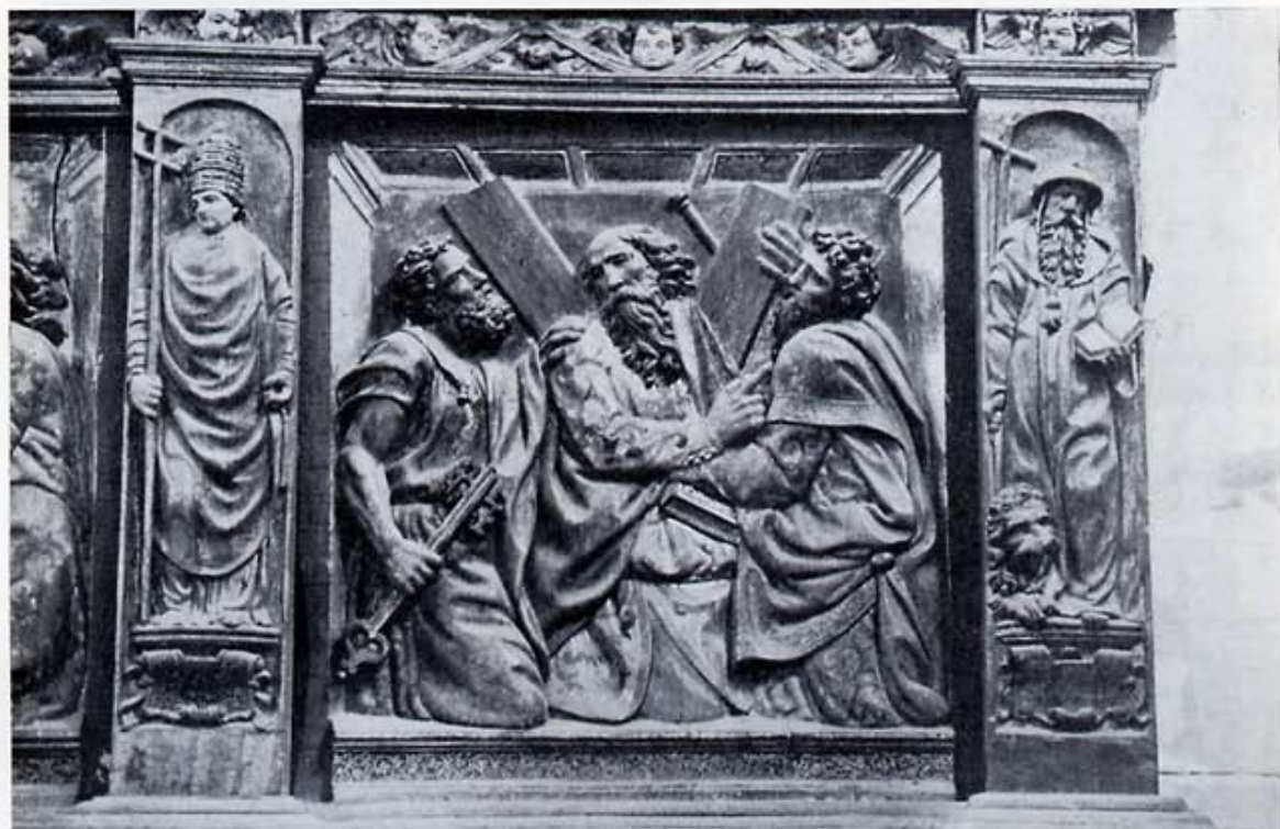
Banco del retablo de Palanquinos: S. Gregorio, S. Pedro, Santiago el Mayor, S. Jerónimo.