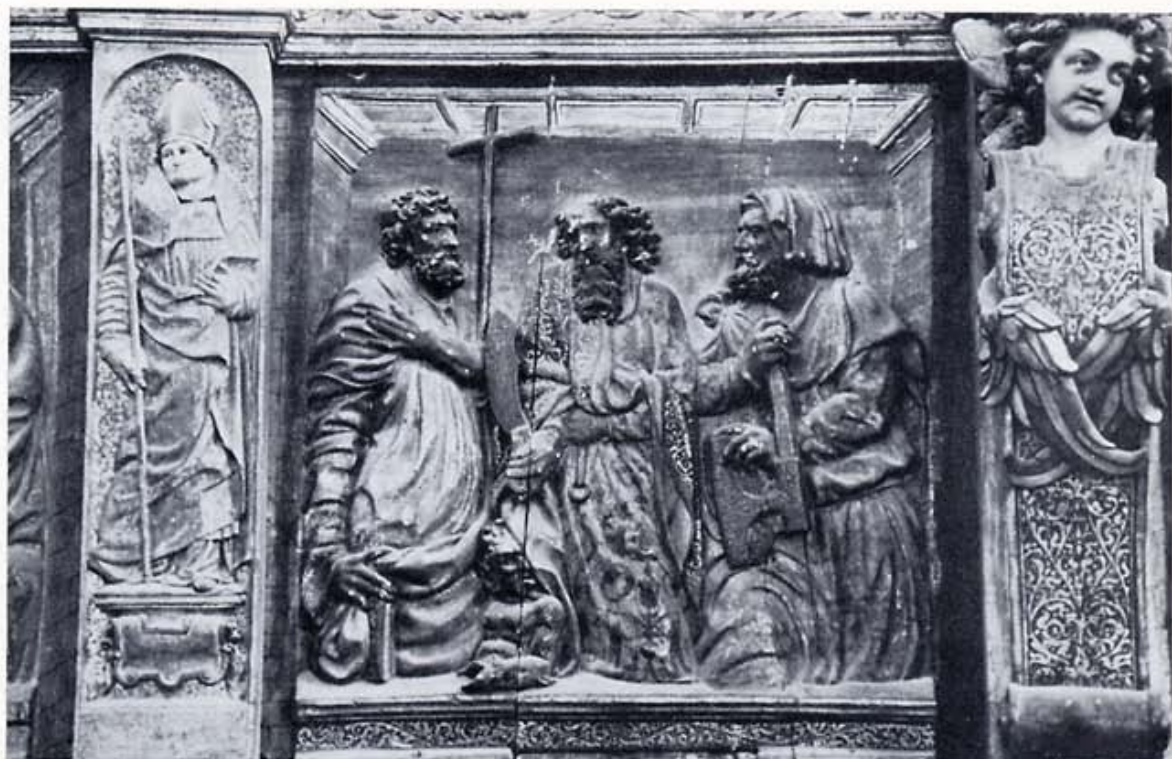
Banco del retablo de Palanquinos: S. Ambrosio, S. Felipe, S. Bartolomé, S. Matías.