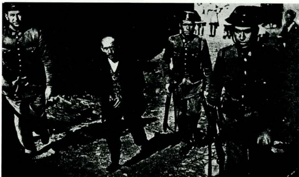
Otro de los detenidos en Bembibre, conducido por la Guardia Civil.