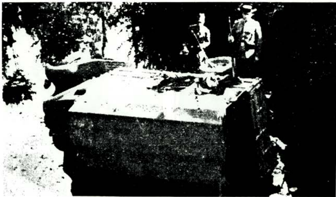
Estado en que quedó el camión de Intendencia tras ser asaltado en el puente de San Román, muriendo un sargento y tres soldados.