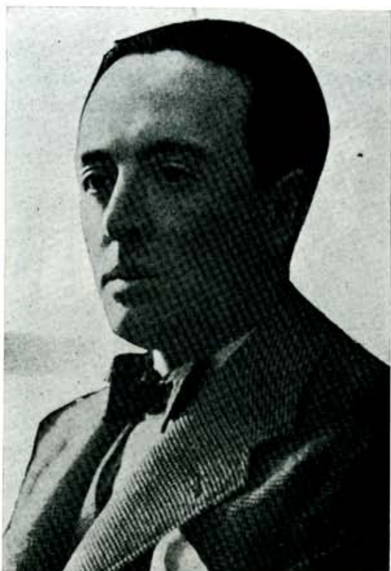
Edmundo Estévez Álvarez, gobernador civil de León en los días de la revuelta de octubre.