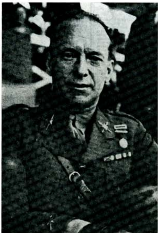
Eduardo López de Ochoa, jefe de las fuerzas militares que dominaron la revolución asturiana en 1934.