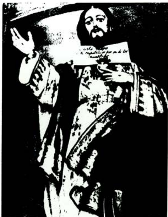
"El "Cristo rojo" de Bembibre; por el color de la túnica se le colocó un cartel que decía: "Cristo rojo: a ti te respetamos por ser de los nuestros". (Fot. "Historia y Vida").