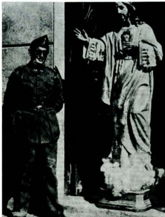
La misma imagen una vez dominada la sublevación de octubre de 1934. Lo anecdótico del color rojo le salvó de ser quemado en la iglesia.