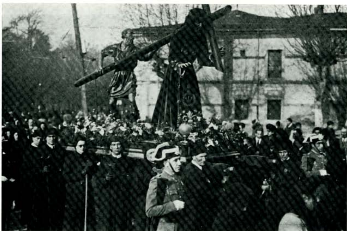
Procesión de Semana Santa, ante el antiguo Hospicio. (Fot. Gracia).