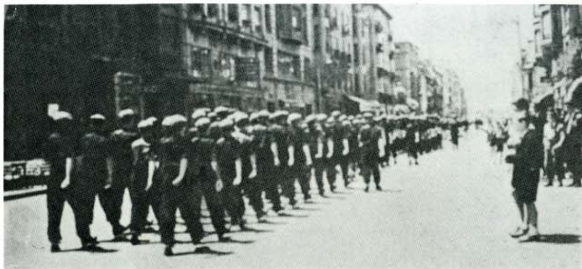
Centurias desfilando por Ordoño II.