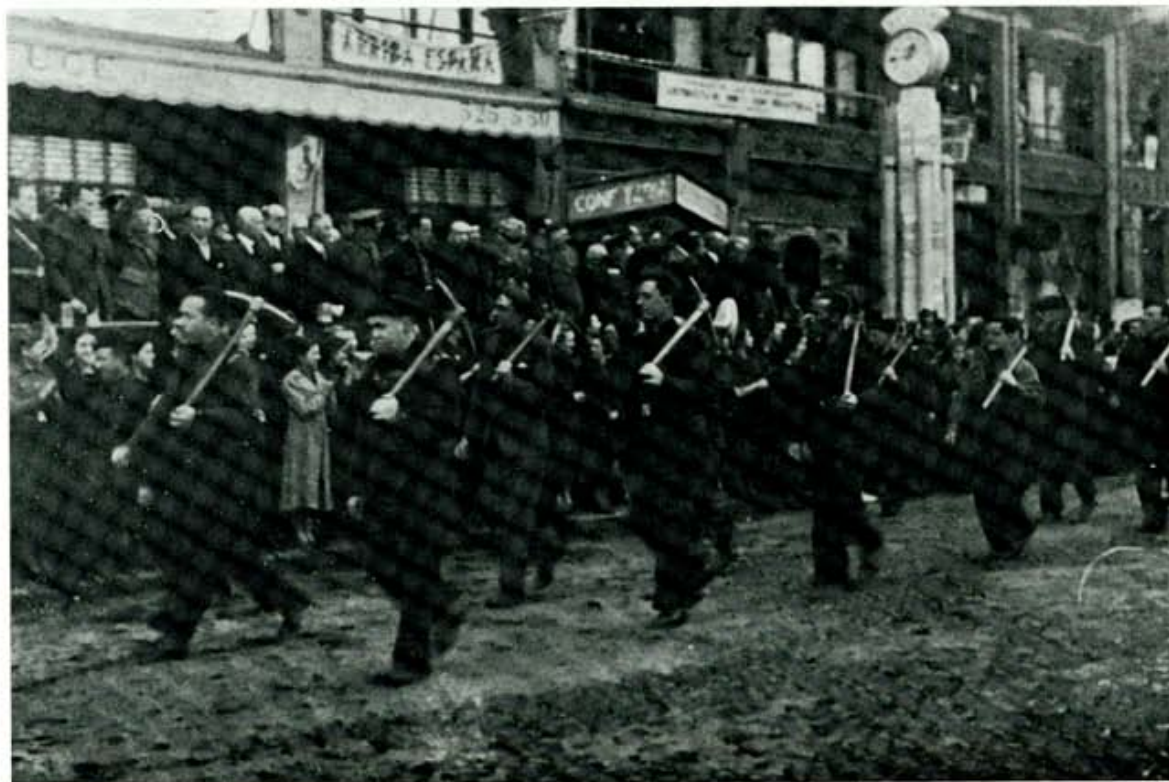
Obreros del "trabajo voluntario" en desfile por la plaza de Santo Domingo. (Fot. Gracia).