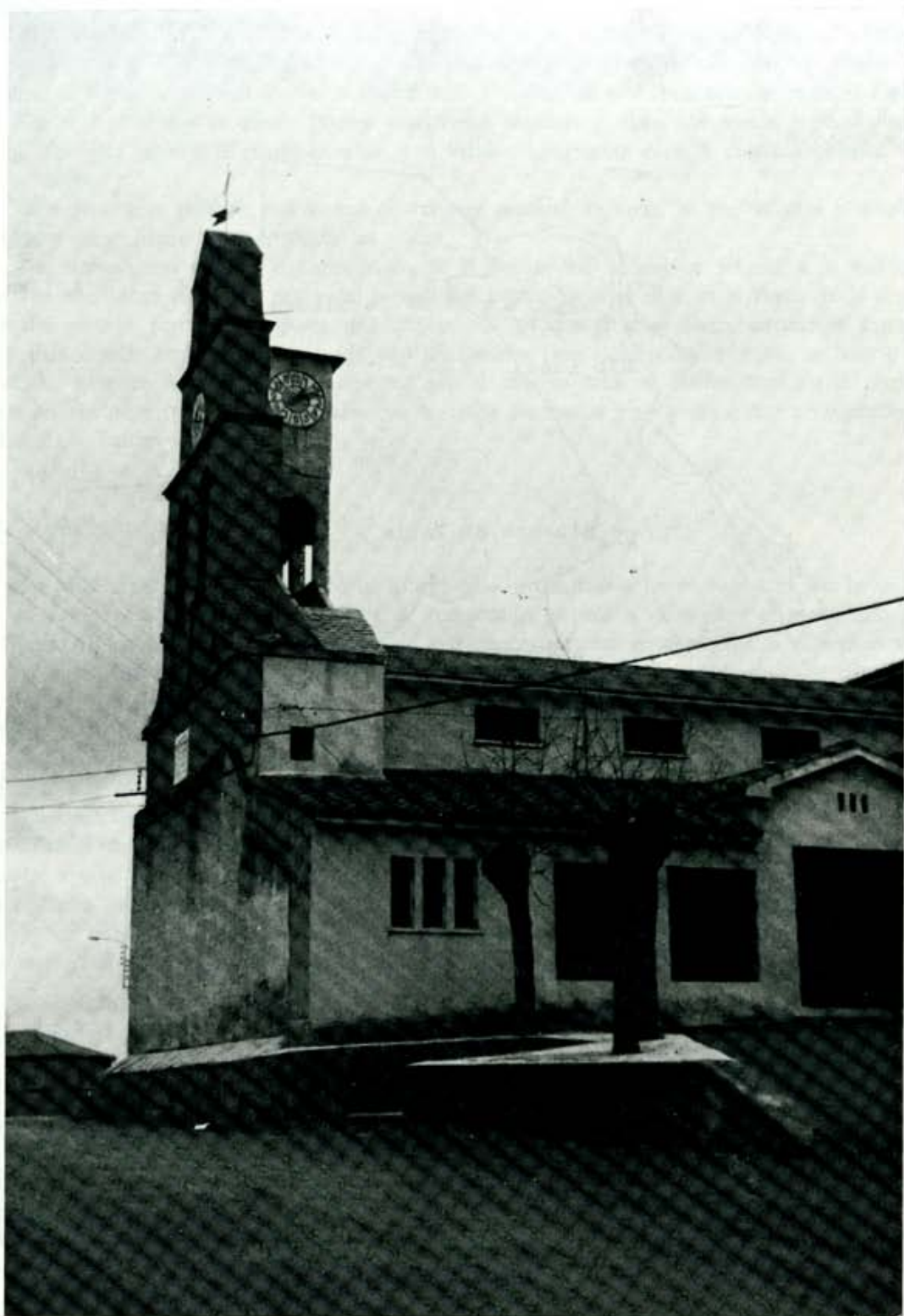
Espinosa de la Ribera: Iglesia de San Saturnino