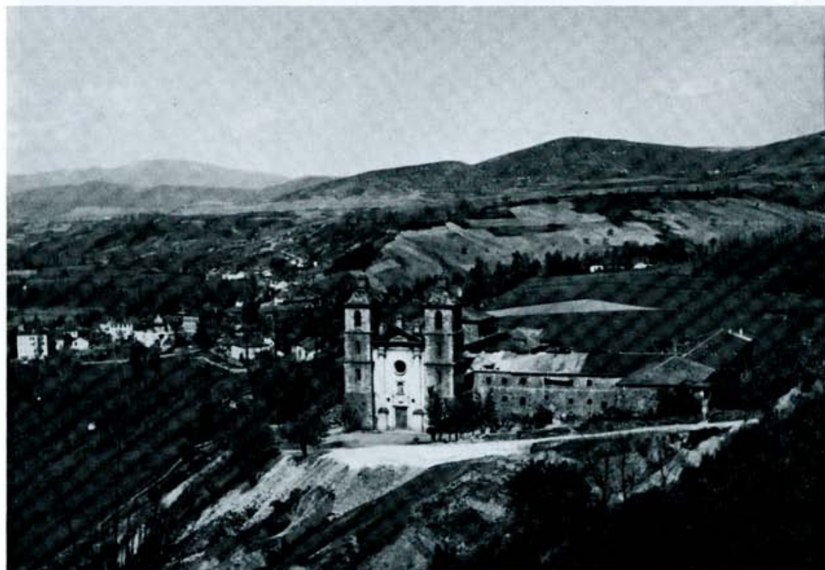
Monasterio de Vega de Espinareda