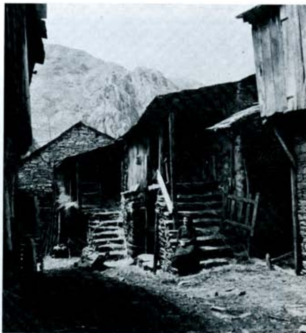
Santiago de Peñalba