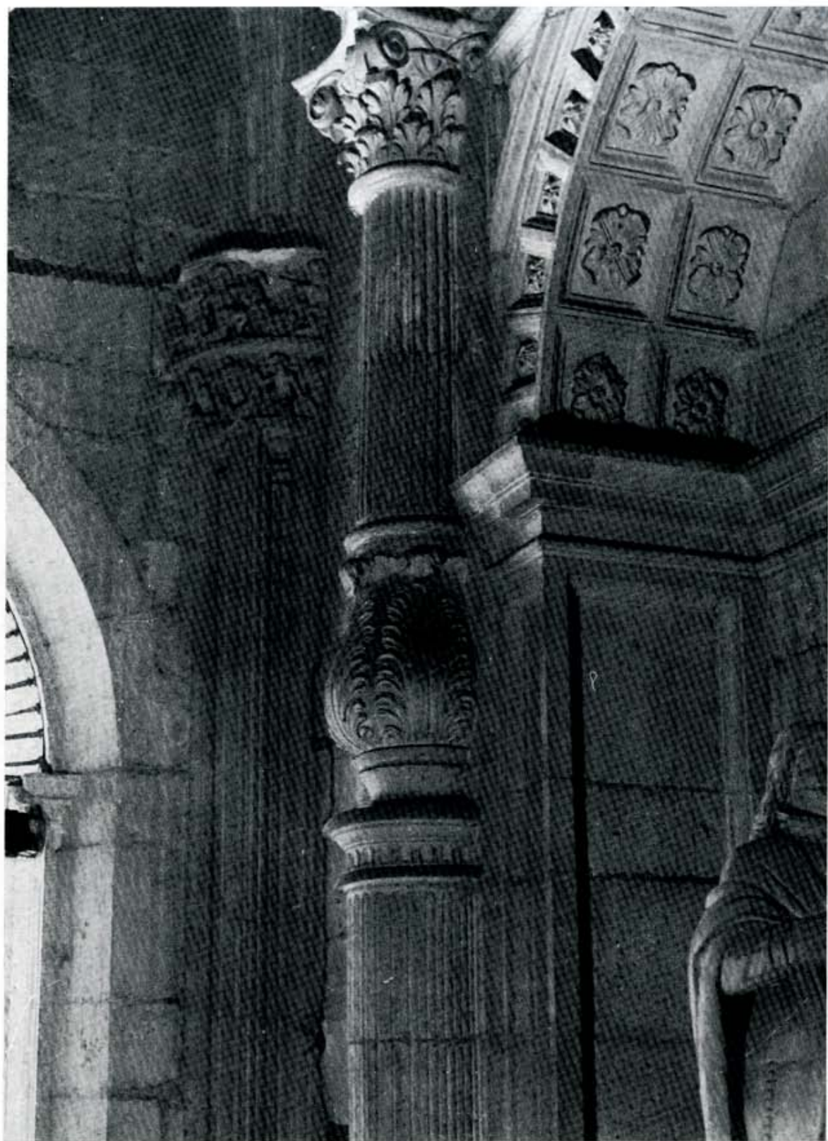
Detalles del sepulcro del Conde