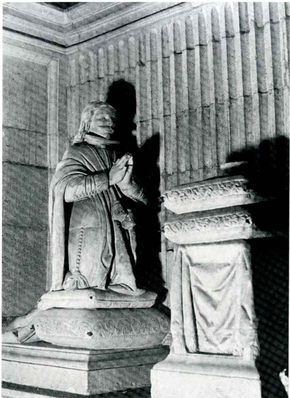
Escultura orante del Conde de Rebolledo