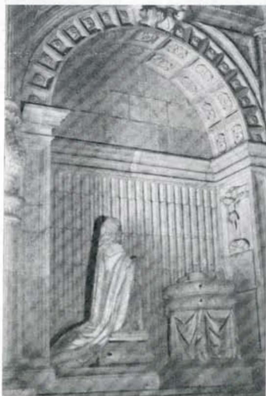
Cuerpo principal del sepulcro