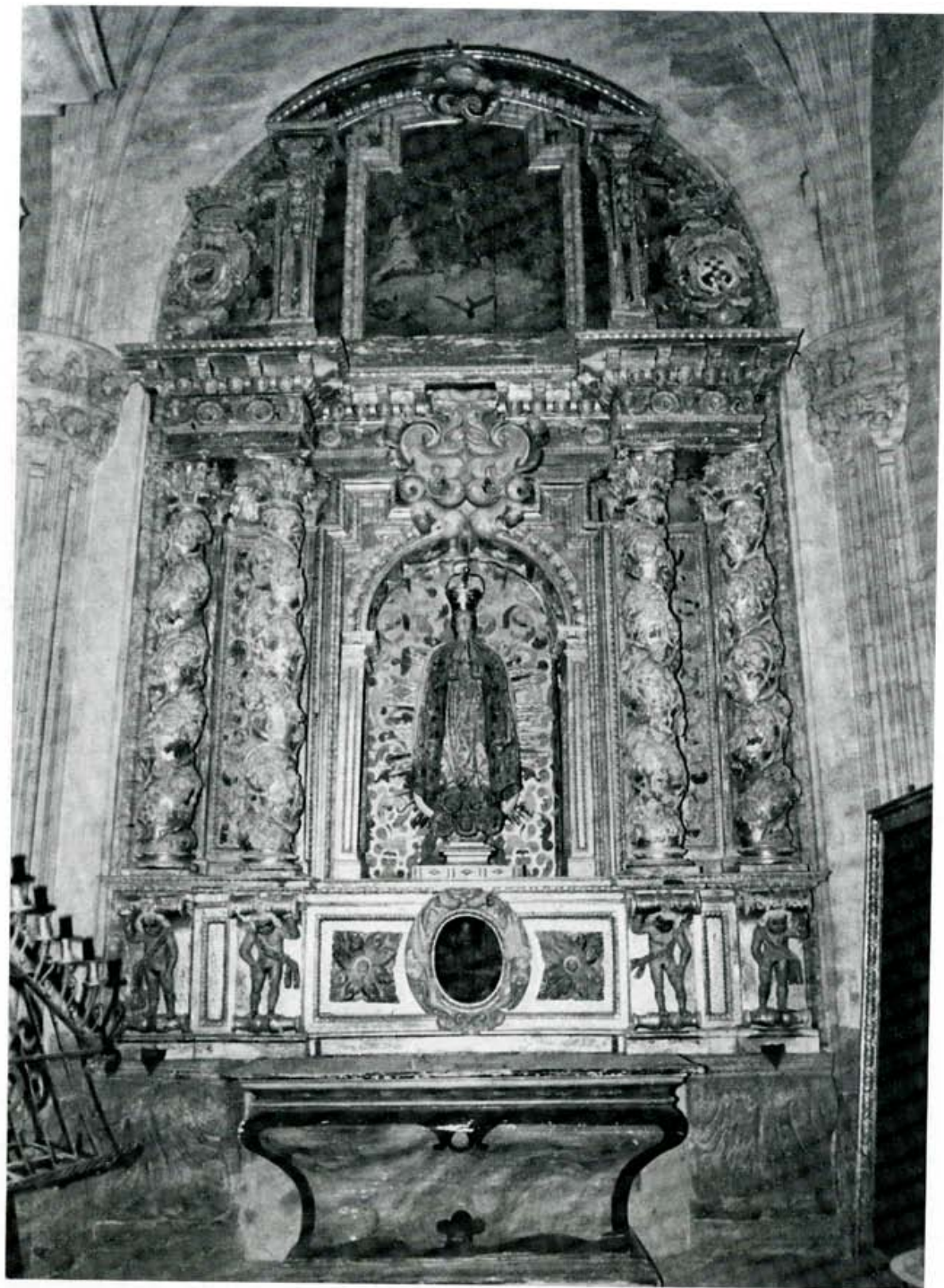
Retablo de la capilla, por José de Margotedo