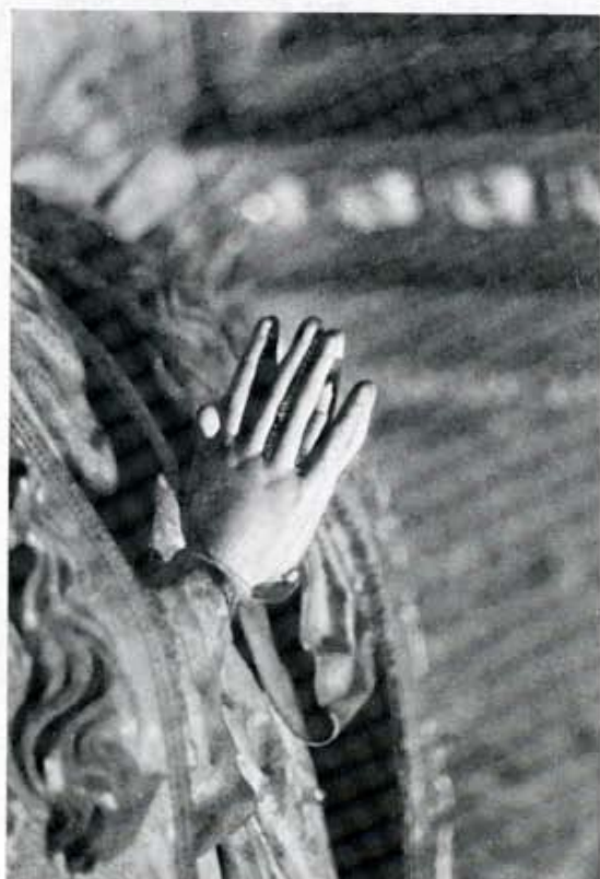
Detalle de la Inmaculada del retablo