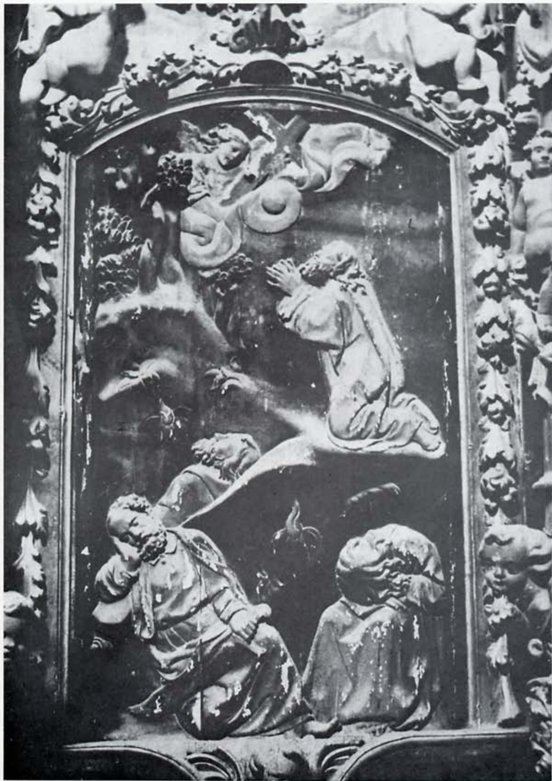
Retablo de Trianos, en Sahagún: "Oración del Huerto".