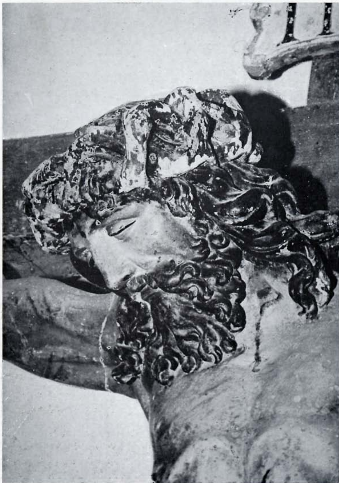
Cristo de Villamol (detalle).