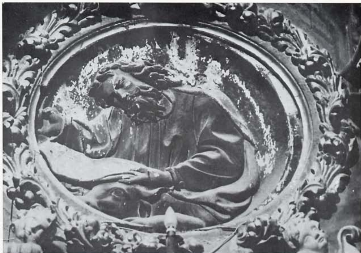
Retablo de Trianos, en Sahagún: "San Lucas".