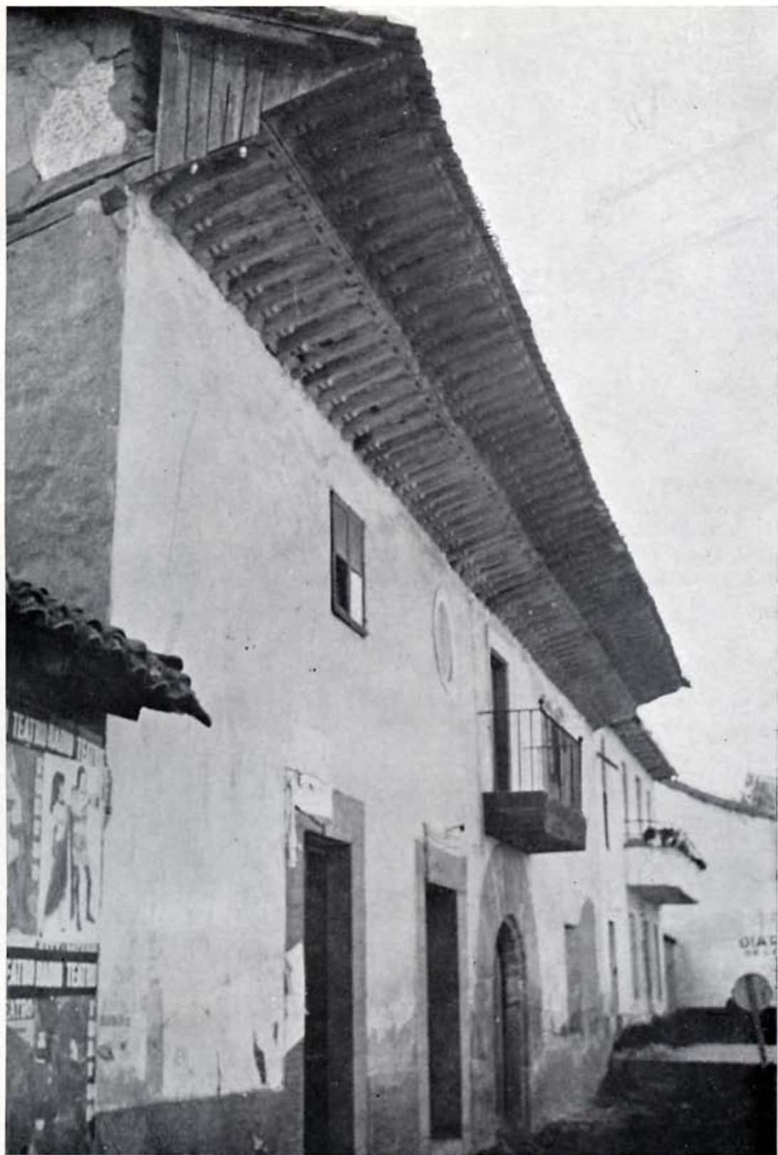
El antiguo Hospital de Villarente.