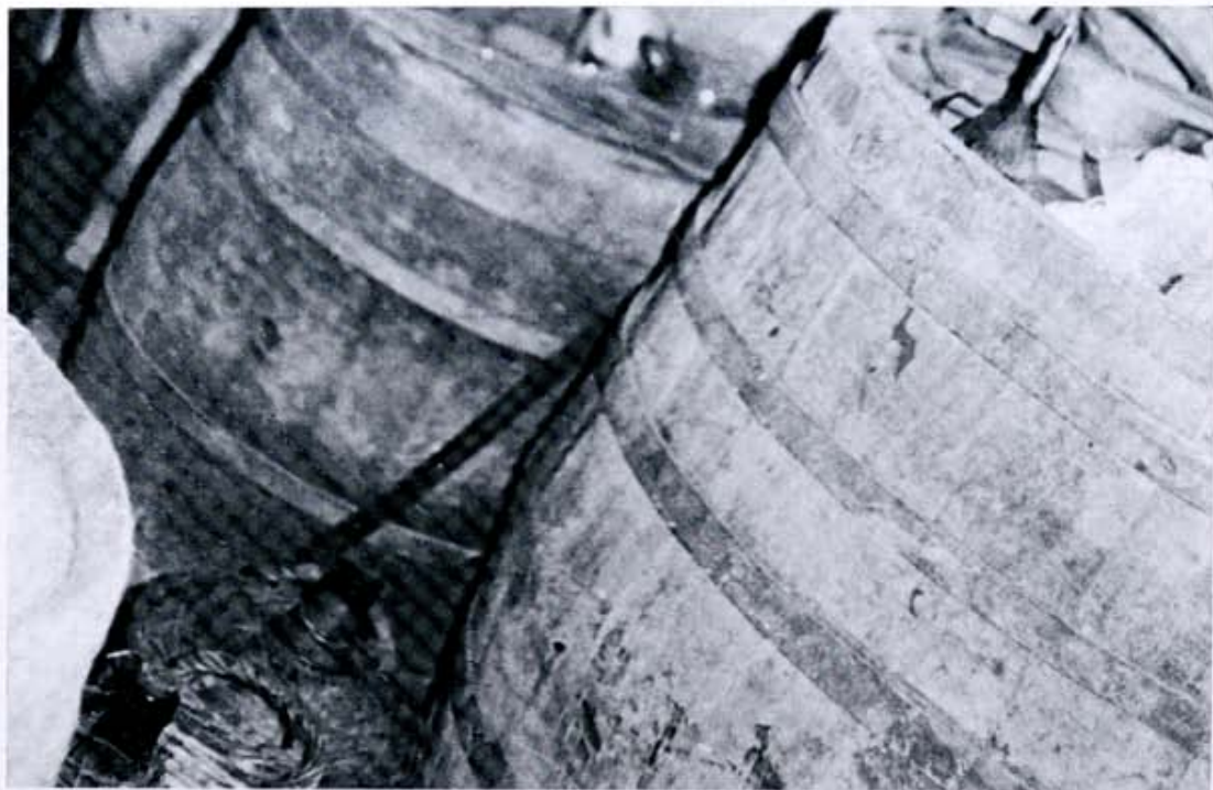
Bocoys y garrafones.