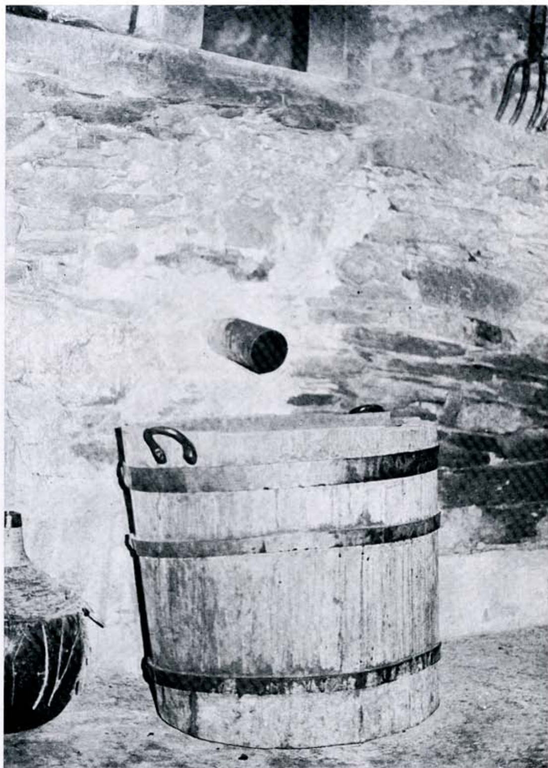
Espita o canilla.