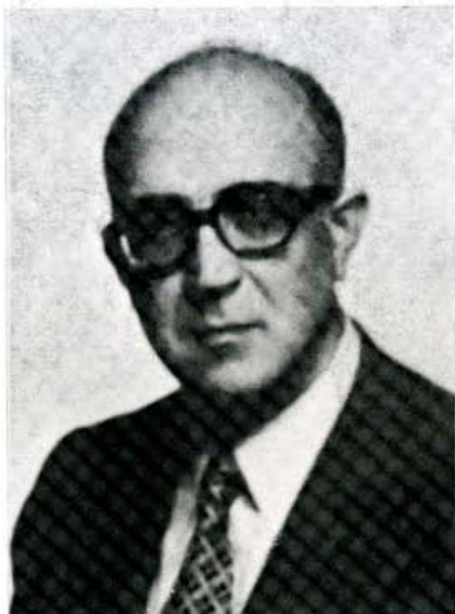
Don Miguel Cordero del Campillo.