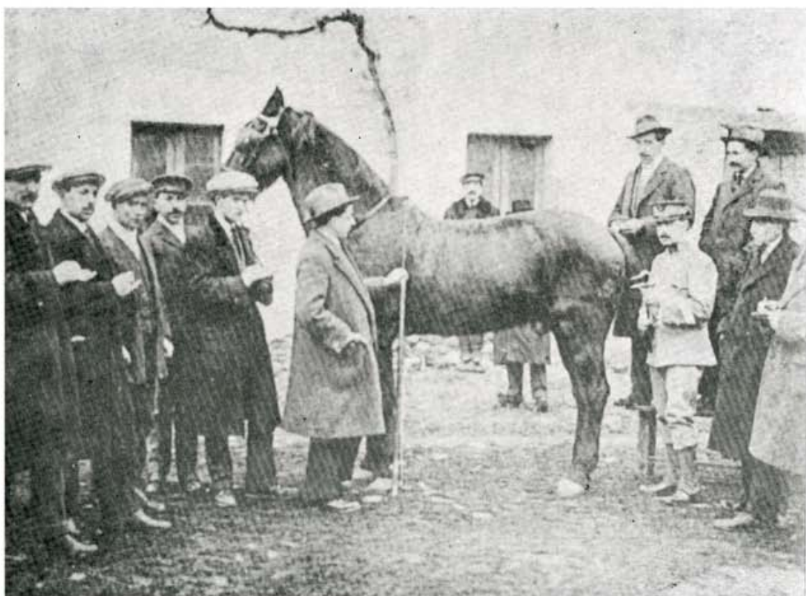
Hacia 1914: Prácticas de Zootecnia.