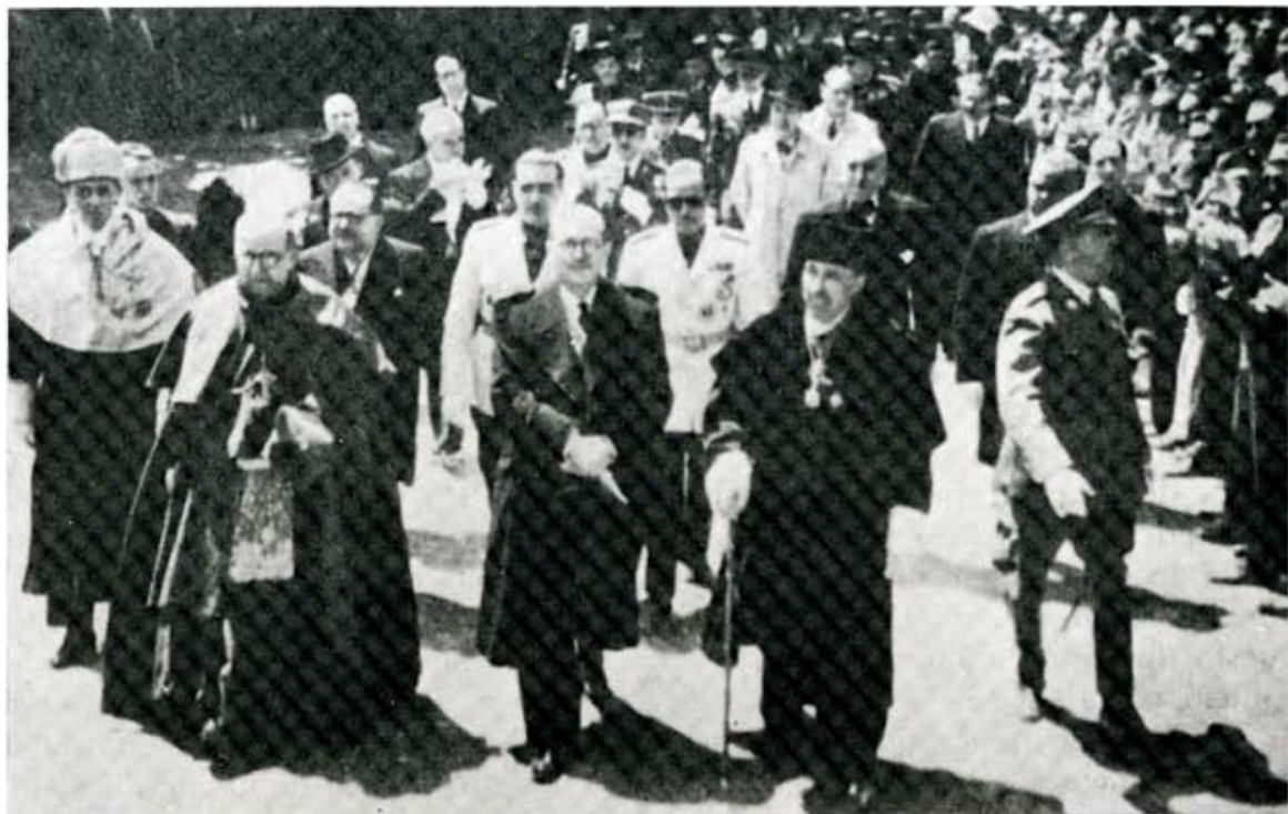
1947: Peculiaridades del estilo académico.