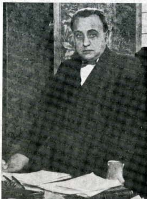
Don Félix Gordón Ordás.