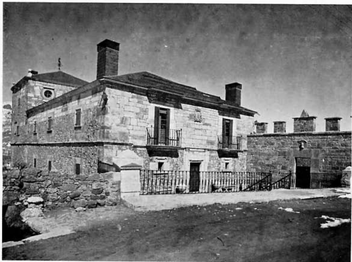
Panorámica de la soberbia casa-palacio que fuera de los Quiñones.