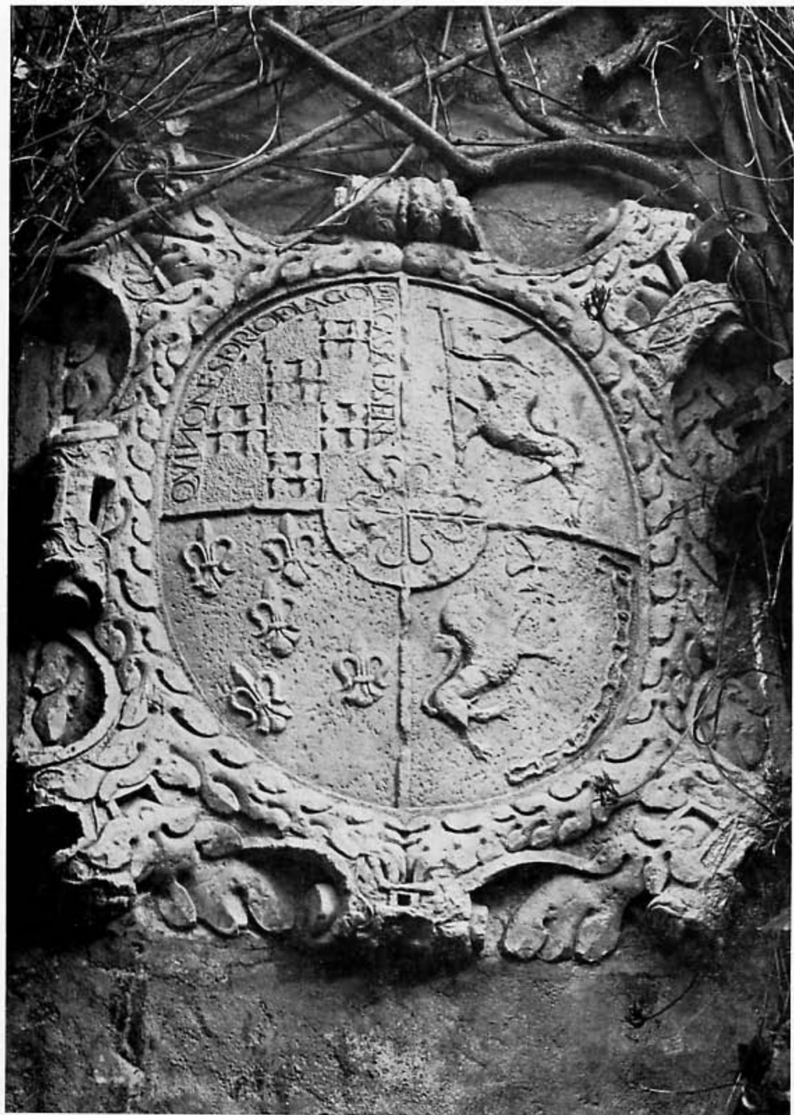
Escudo procedente de Riologo y, actualmente, en la residencia "El Quiñón", en San Juan de Luz (Francia), propiedad de la marquesa de San Carlos.