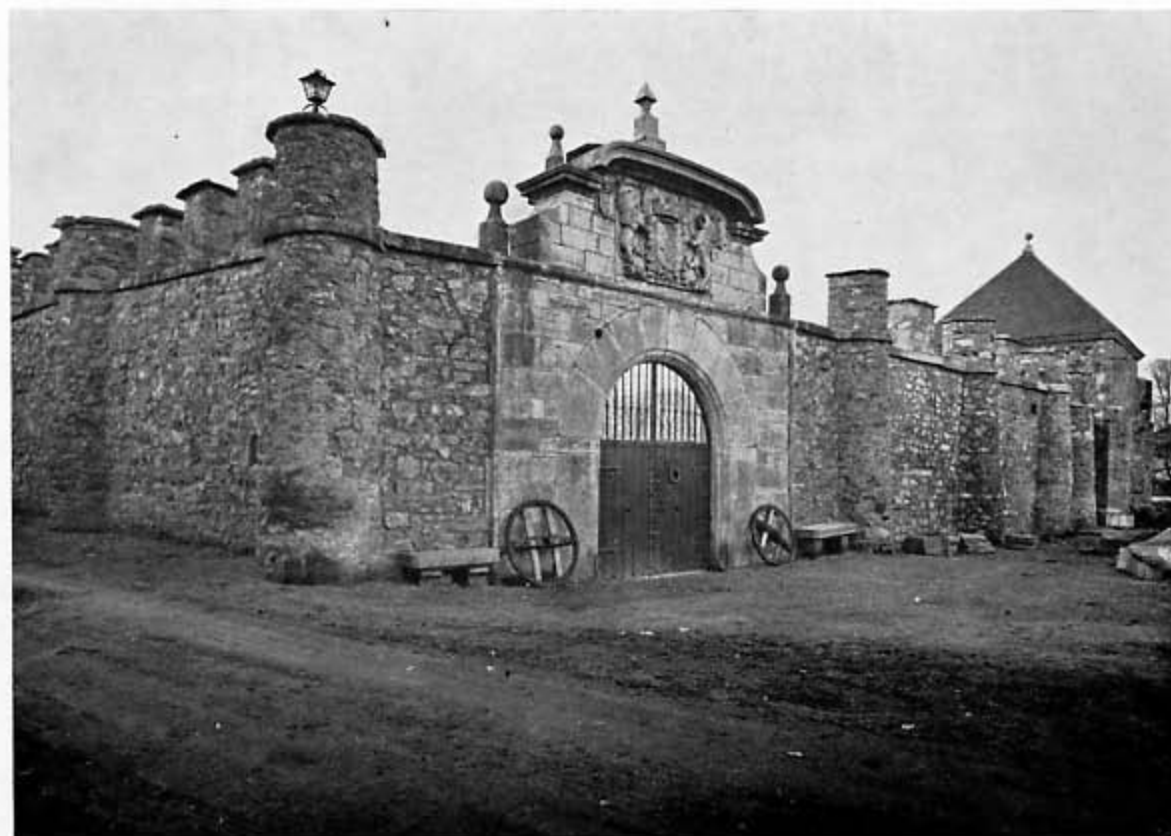
Perspectiva de los laterales este y sur de la muralla que rodea la casa-palacio de los Quíñones, con la espléndida portada blasonada.