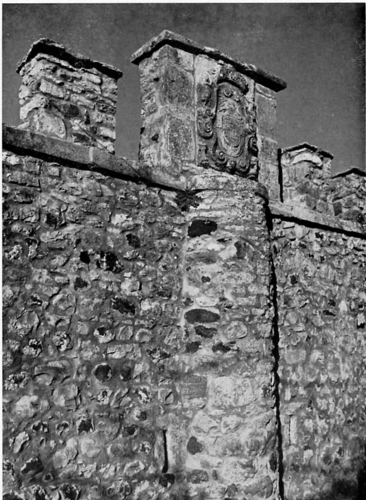
Detalle de la muralla meridional con su almena blasonada.