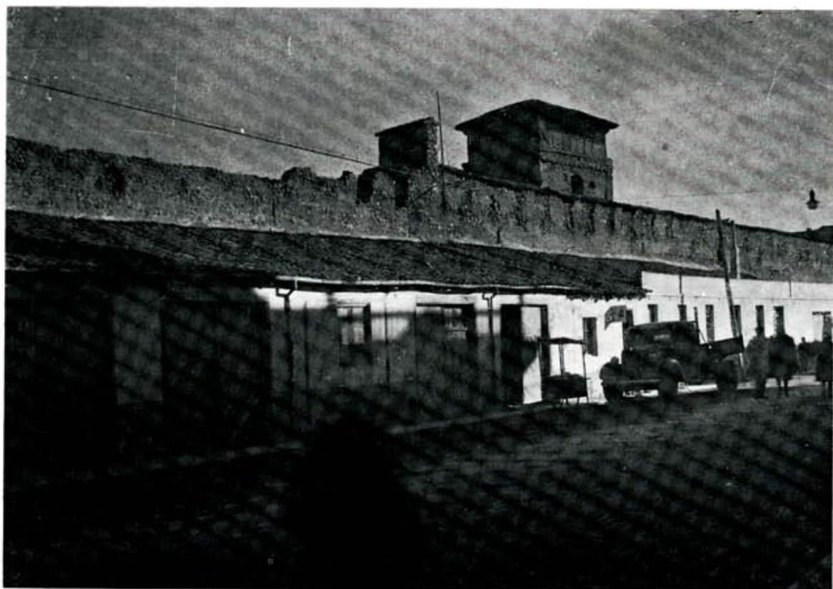
En uno de los principales accesos al centro de la ciudad, tendejones adosados ocultan aún hoy a la vista la cerca medieval, presidida por la torre maciza del convento concepcionista.