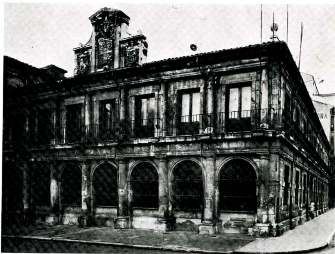
Cuerpo originario del Ayuntamiento, obra de Juan de Rivero, sometido a reciente ampliación.