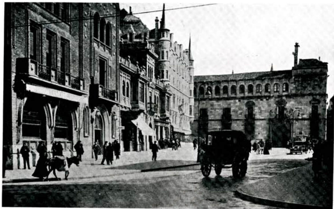
Solar de contrastada calidad, el contacto entre el intramuros y el Ensanche, cuando la ciudad no se hacía en función del automóvil.