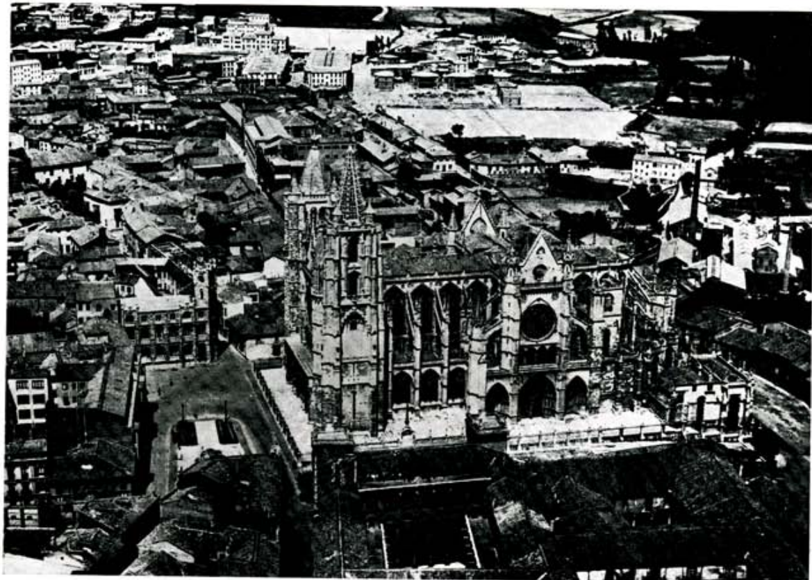
Casi medio centenar de edificios desaparecidos separan esta instantánea de la actual; con ellos, el adiós a la cultura urbana. (Foto MAS).