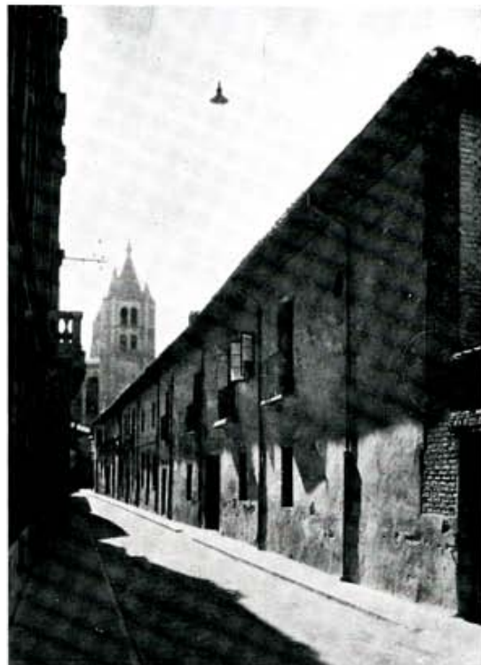
En el barrio de Regla, la antigua calle de la Canónica, tradicional asiento de la curia, convertida hoy en sector escolar religioso de remodelación masiva. (Foto MAS).