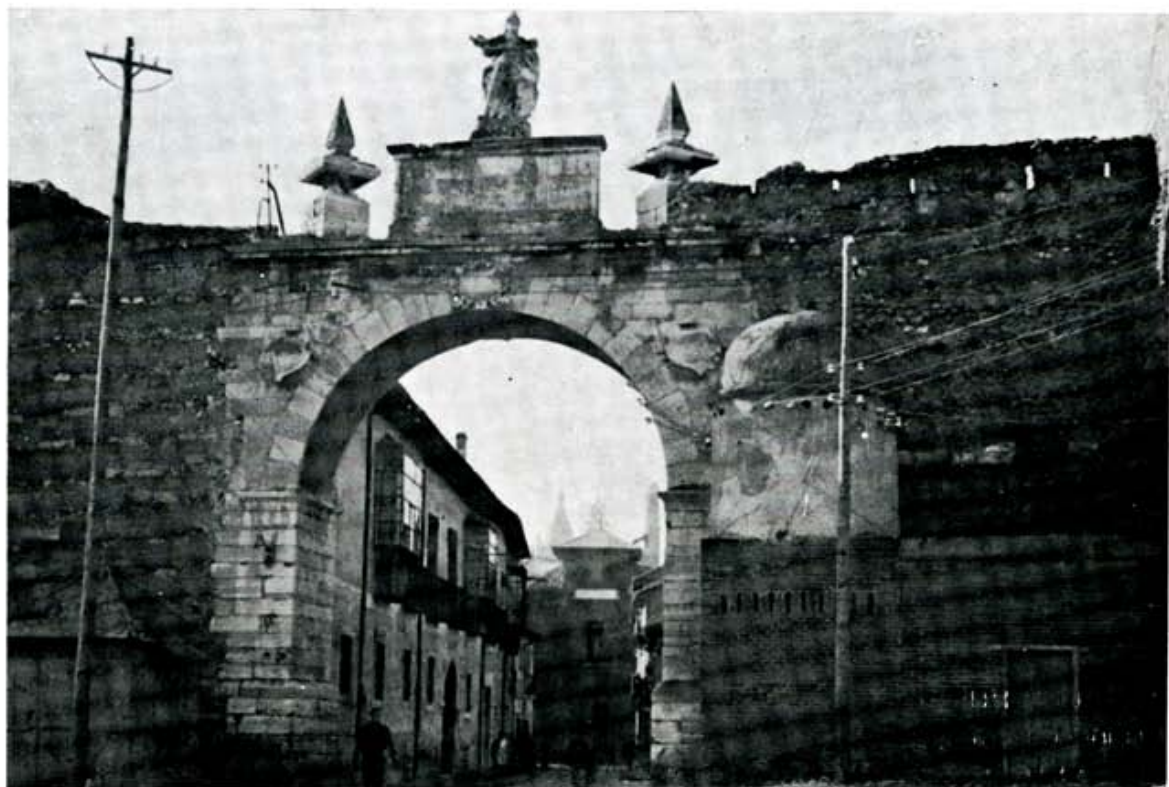
Arco del Castellón, acceso del muro romano al barrio de Santa Marina, con fondo de una de las muestras desaparecidas de la arquitectura leonesa en ladrillo.