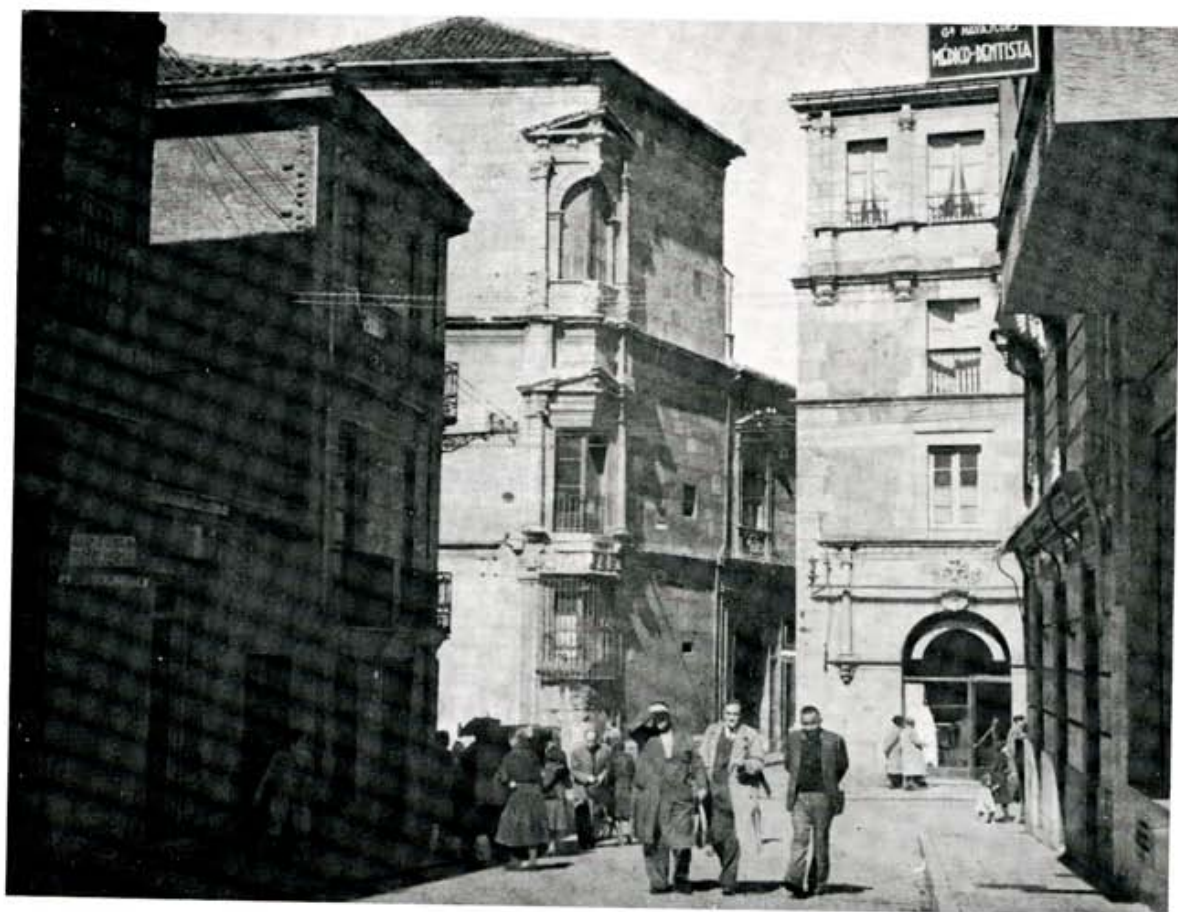
La antigua calle de Pelegrín en su desembocadura a la fábrica renacentista del primer tramo de la calle Ancha.