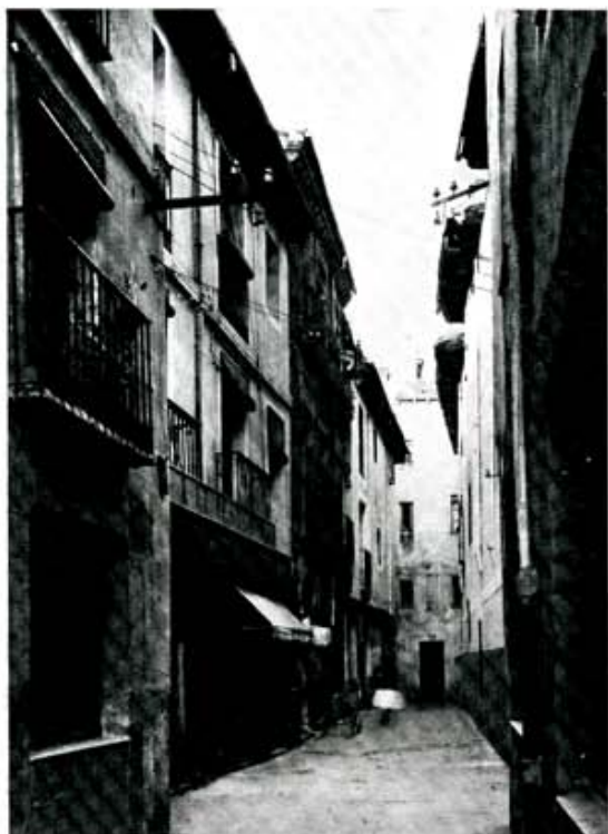
Azabachería, rúa gremial de acceso al mercado y antesala del "Barrio Húmedo", antes de la invasión terciarizadora que traería el deterioro. (Foto MAS).