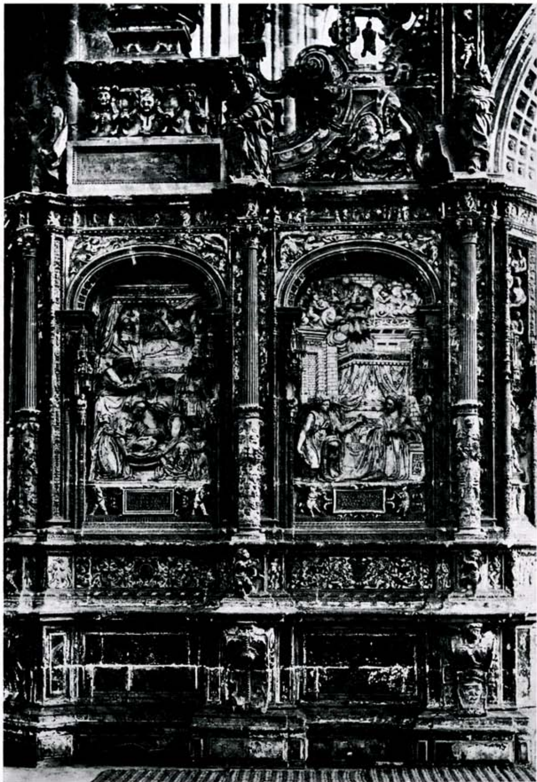
Catedral de León: Trascoro, lateral izquierdo.