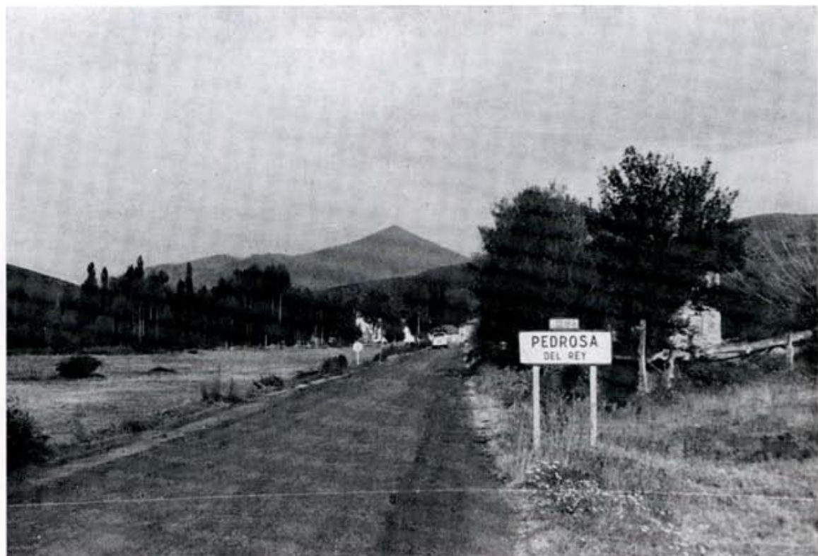
"En Pedrosa del Rey, una mañana, vio la luz don Antonio de Valbuena..."