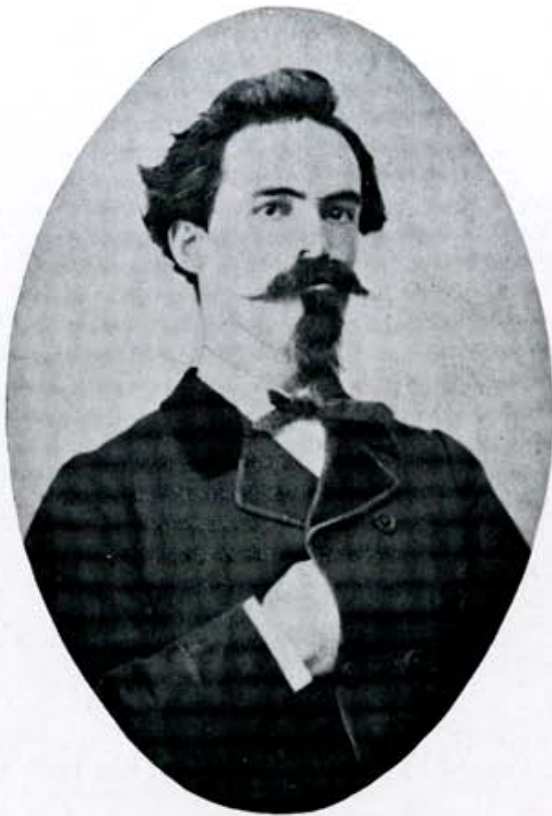
El estudiante de Leyes.