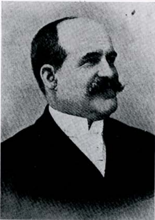
Ya cincuentón y afamado crítico.