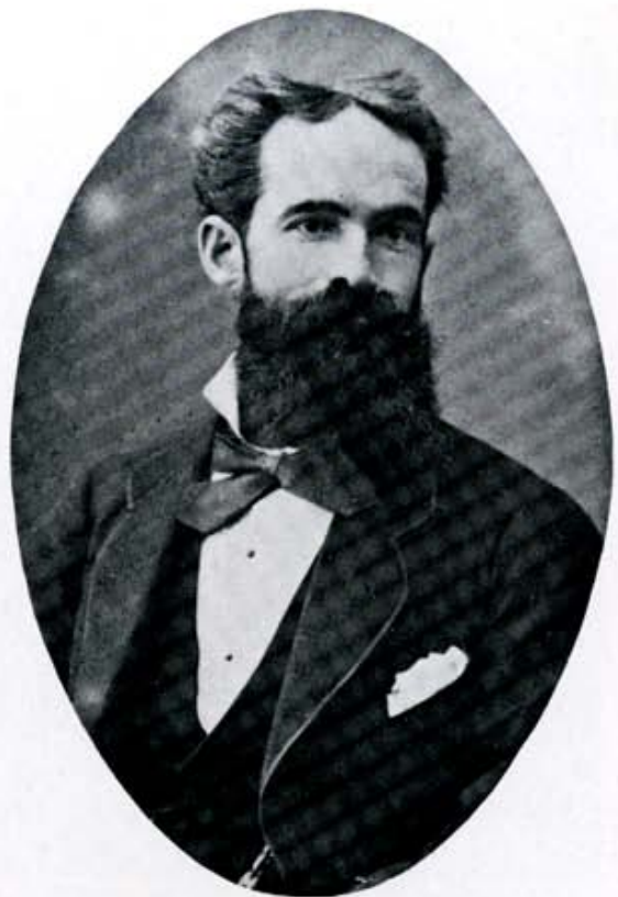
A los treinta y tantos años, en sus inicios de periodista.