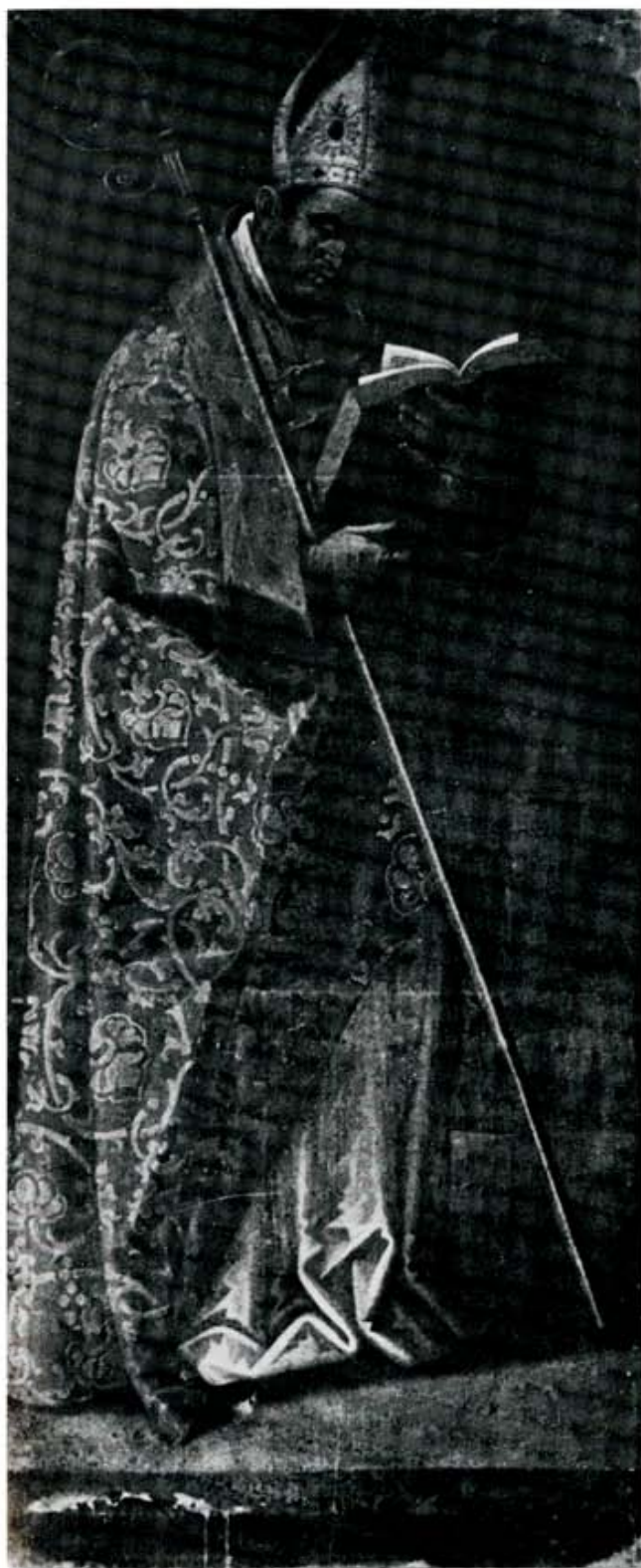
Catedral de Astorga. Retablo de la Majestad. San Genadio, por Peñalosa.