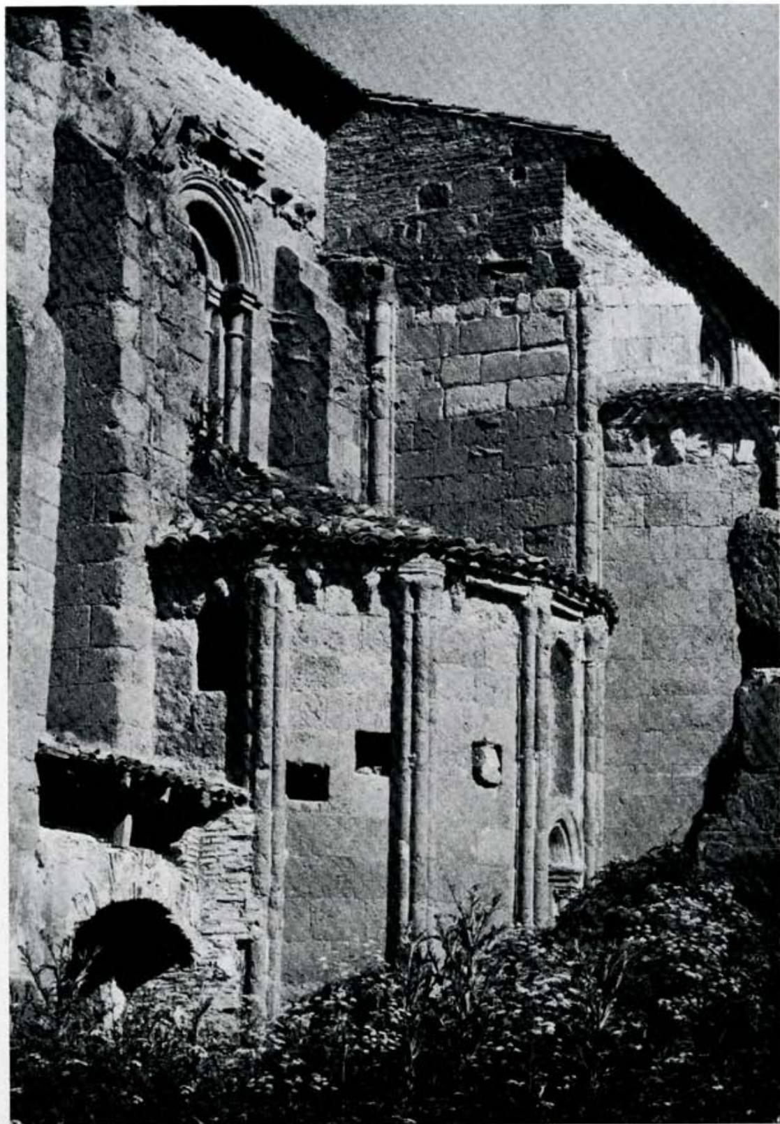
Santa María de Sandoval, poco más que lamentables ruinas.