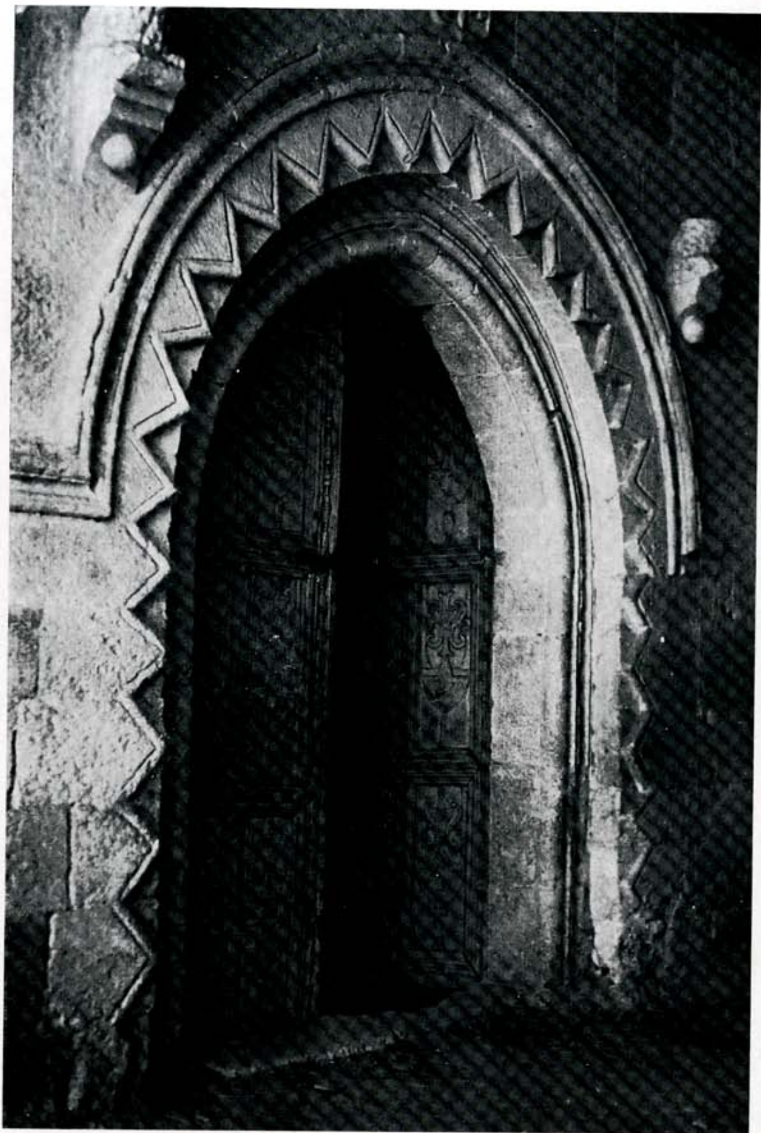
Santa María de Gradefes: puerta de acceso al templo.