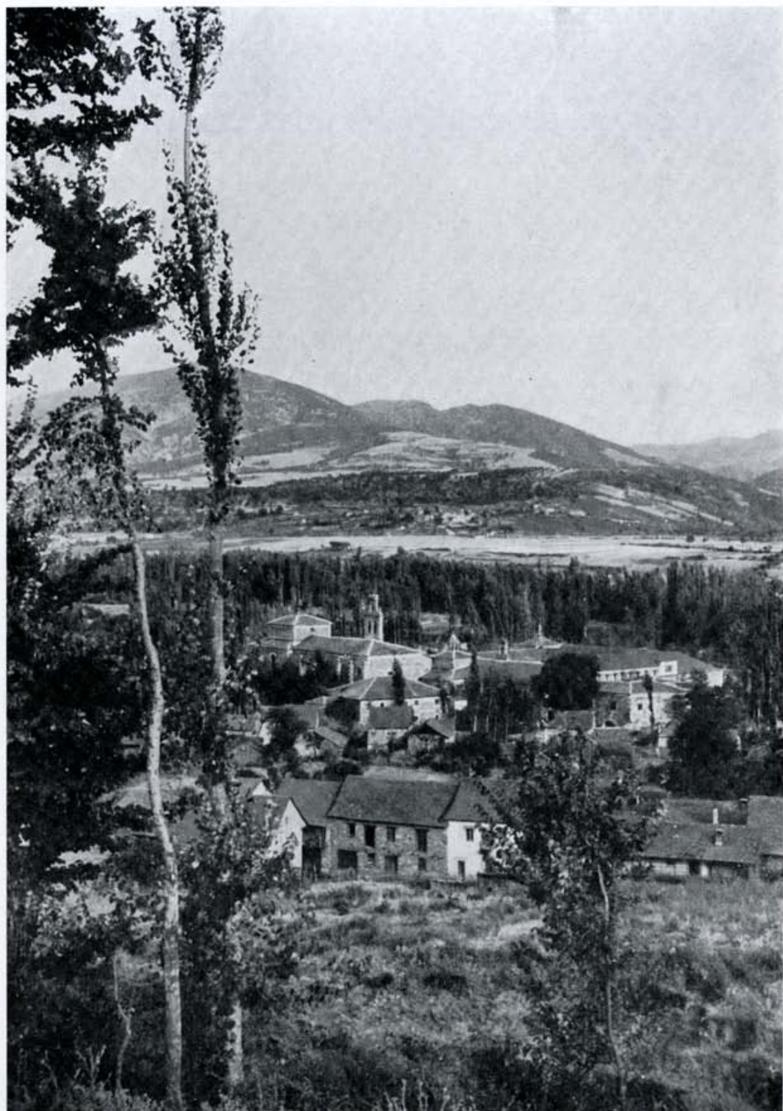
Dentro del paisaje berciano, el monasterio de San Miguel de las Dueñas.