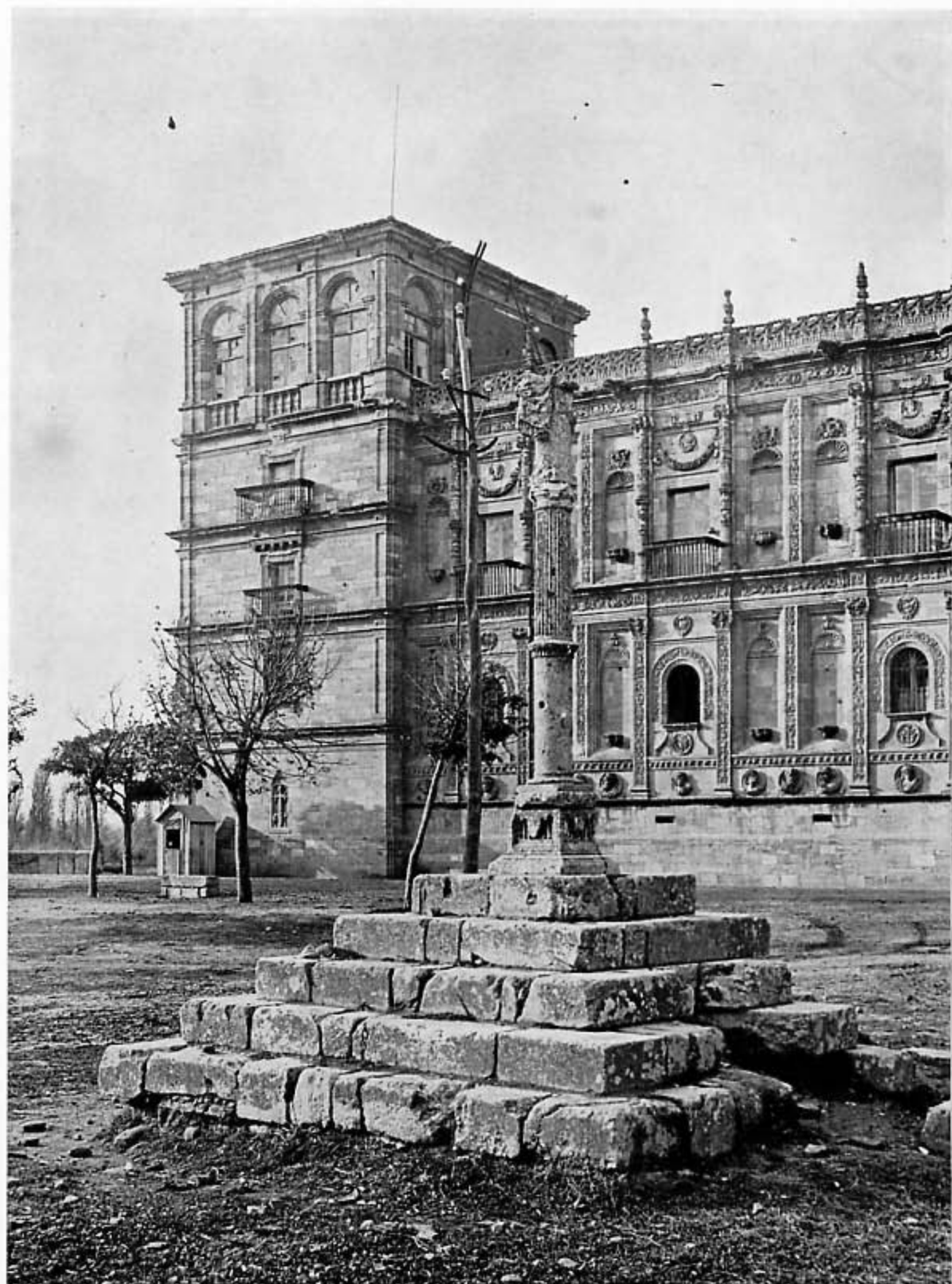
"...y la vecindad de un río que tengo a la cabecera..."