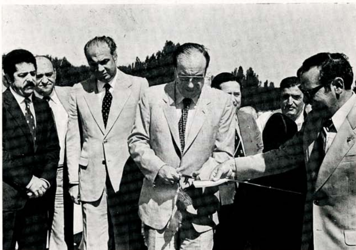
Inauguración de la variante que elimina el paso a nivel de Villalbalter.