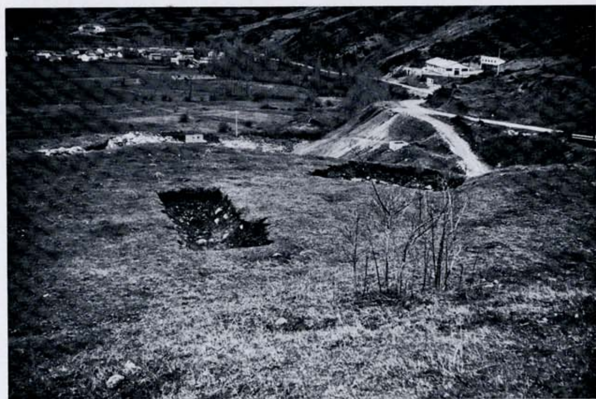
Fig. 5. Riaño.