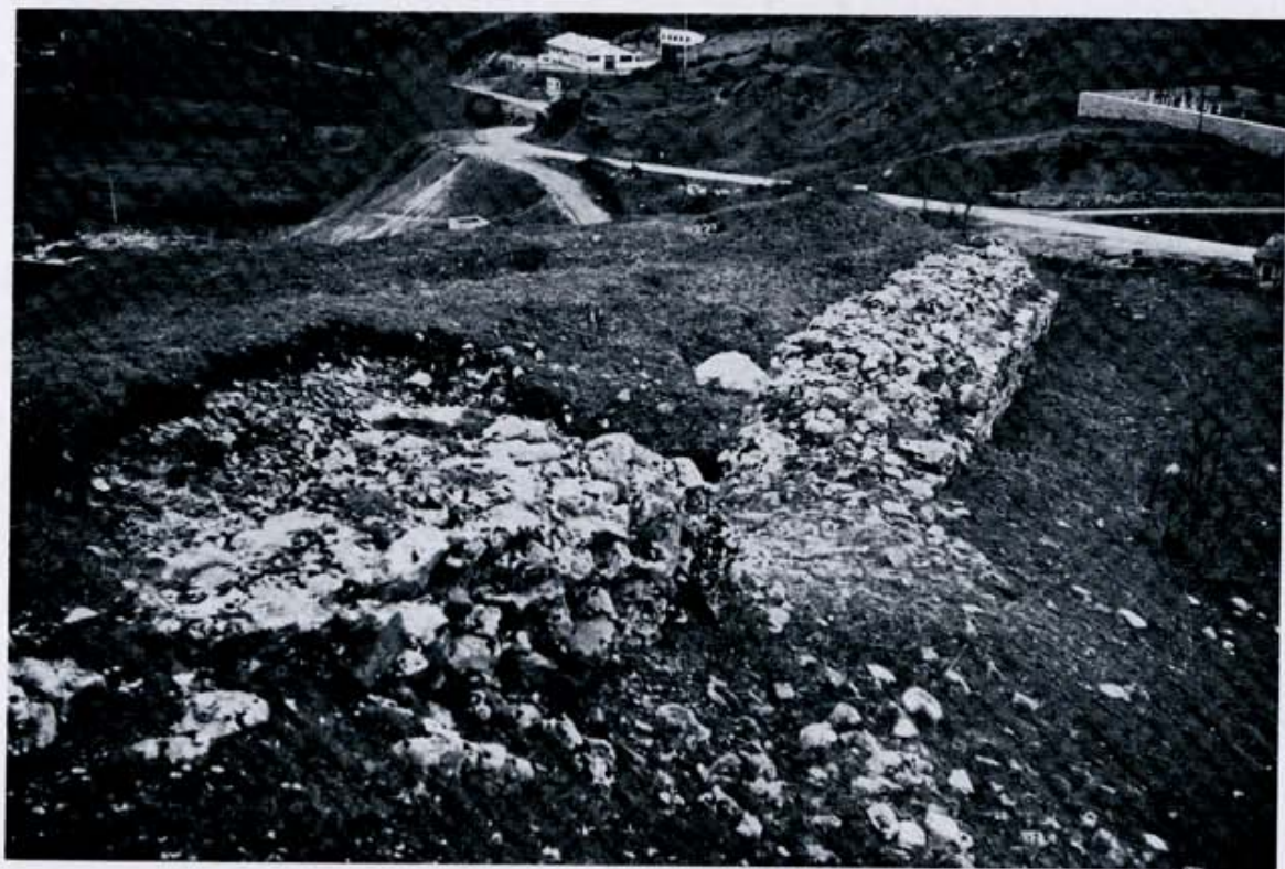
Fig. 4. Riaño.