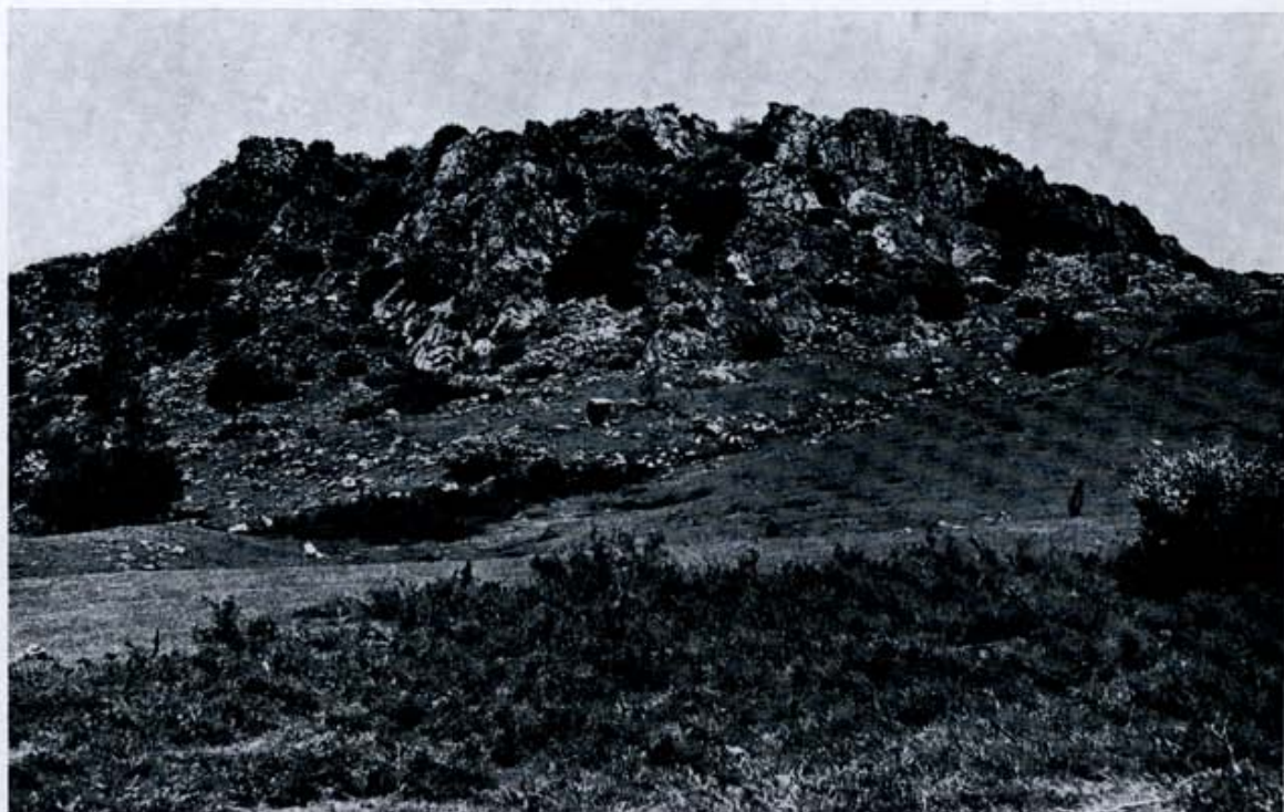
Fig. 1. Boñar.