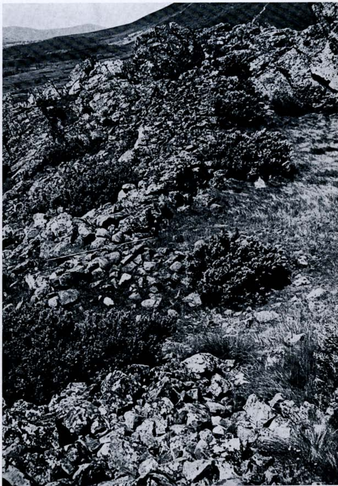
Fig. 3. Boñar.