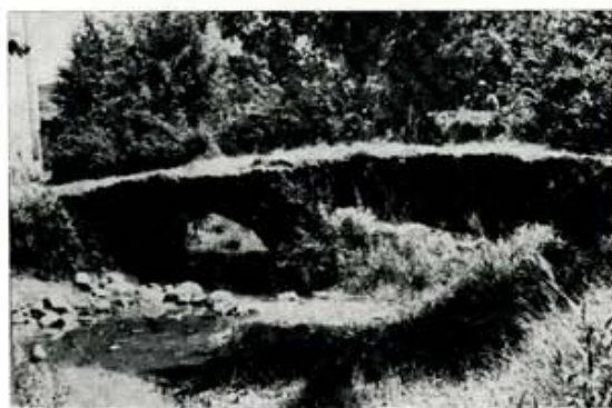
5. El Pontanal de San Pelayo.

La Marcilla es un despoblado situado, para mejorar referencia, frente al Km. 1 del camino vecinal que nos une a Calzada, pasado el regadío y tras subir una suave loma. Se aprecian en superficie abundantes restos de cerámica, sobre todo tegulae de diversos tipo y grosor, pizarra, trozos de