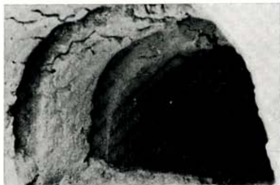
6. Horno de Peñalamora.

molinos de mano, etc. El estudio y clasificación de lo encontrado nos ha llevado a concluir que fue lugar poblado desde épocas bastante remotas (al menos primera época romana —19—) hasta fecha relativamente reciente, pero anterior a 1.590, pues ya no se cita en visitas.