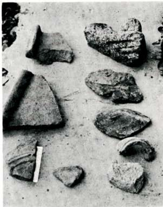
4. Cerámica y piedras de El Real.