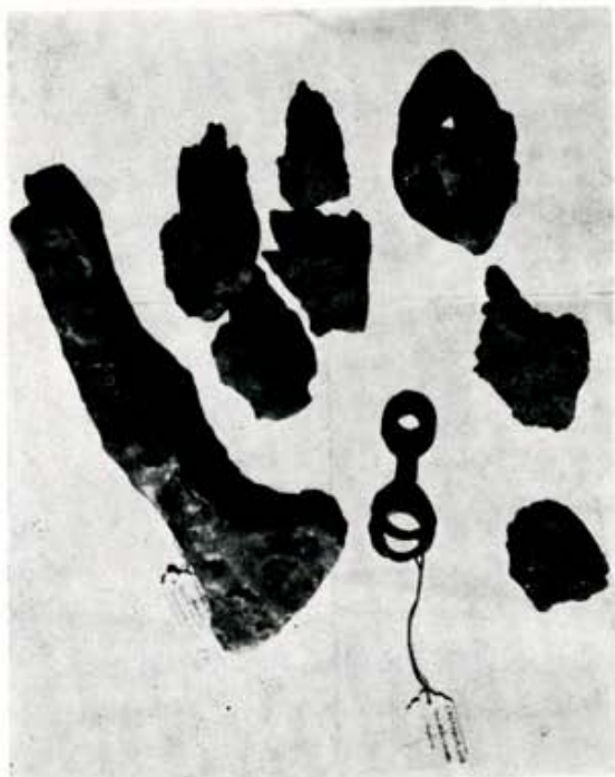
3. Cerámica y hierros de Los Casares.