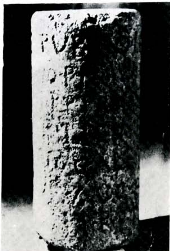
1. Miliario. Encontrado en La Chana. Castrocalbón.