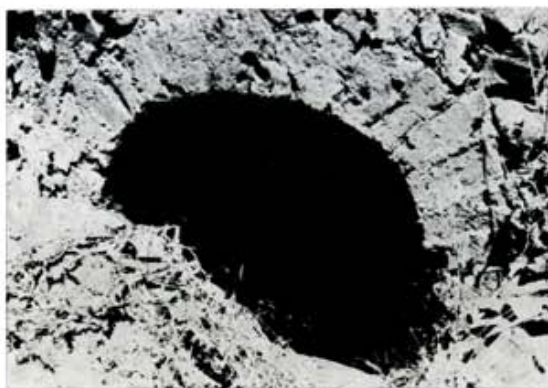
7. Horno de Peñalamora.

A poco más de un kilómetro del punto donde apareció el miliario, ya en lo alto de la sierra, hay un camino que atraviesa la calzada y va por la cumbre hasta la carretera. En el ángulo N.E. del cruce calzada-camino abunda la tégula y también encontré fragmentos de granito con dibujos (dos como la parte superior de un ara). En el ángulo S.E. se hacen notar restos de paredes que pudieran ser antiguas. El despoblado es claro y la situación topográfica más los restos me hacen suponer la instalación en el lugar de una torre para vigilancia, relacionada con la vía (23).