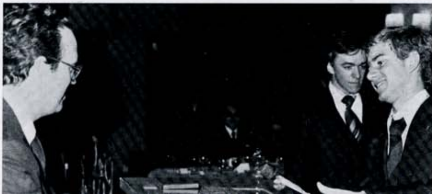
Un momento de la entrega de trofeos en la Gala del Esquí.

El verso, se transforma en prosa triste. Fallece el ex-alcalde de León, un hombre querido de todos: don Alfredo Alvarez Cadórniga. El sepe-lío constituye una verdadera mani-festación de duelo. Sus nueve años al frente de la alcaldía fueron positivos, efectivos y dejaron "huella".