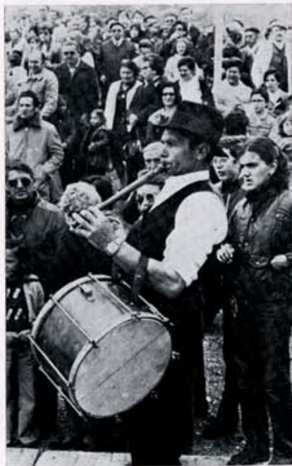
Las manifestaciones folklóricas leonesas, como cada año, se dan cita en la romería montañera de San Isidro