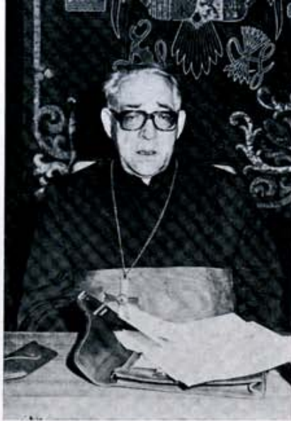
Monseñor Marcelo González, Cardenal Primado, pronunció la conferencia de clausura del ciclo dedicado por la Casa de Cultura a la juventud.