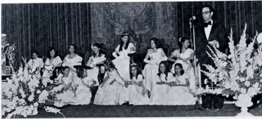
Las Justas Literarias de las fiestas de San Juan y San Pedro de León.

guez. Es la Ciudad en fiestas, la ciudad en la que vivo y he de morir. La que todos llevamos hecha latido en nuestras venas. Evoco algunas de las palabras del mantenedor: "Y vamos a llamar a los poetas, como en esta noche. Y cuando los poetas vengan, como algunos de aquellos trovadores de la Provenza, a robarnos el amor, a robarnos la fe o a meternos dentro de sus disputas y a hacernos blanco de sus fanfarronadas, vamos a ahogar sus voces en nuevo canto de esperanza y de vida".