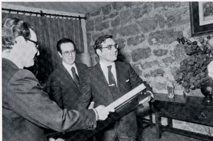
22 abril: el Ministro del Interior, D. Rodolfo Martín Villa, recibió el título de “Leonés del año”, correspondiente a 1976.