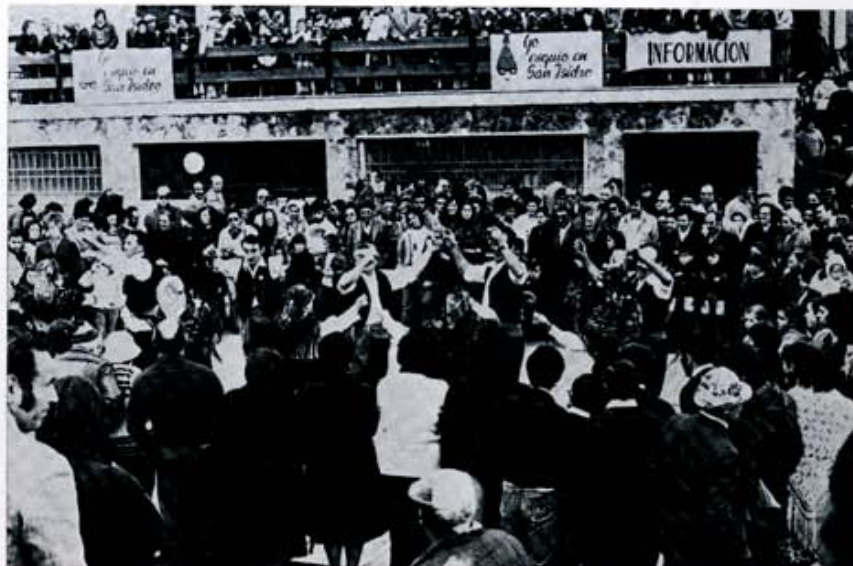
15 mayo: alegría tradicional en la romería del Puerto de San Isidro, fiesta consolidada en la fraternidad deportiva y popular de las tierras leonesas con las provincias limítrofes.

Una frase: "Los valores del espíritu no pasan de actualidad". La pronunció el cardenal primado al clausurar, en la Capital, un ciclo de conferencias dedicado a la Juventud. Monseñor Marcelo González, entre otras cosas, señalaría: "Llegará pronto una nueva juventud que proclamará la necesidad de volver los ojos al mundo del espíritu". Al acto de