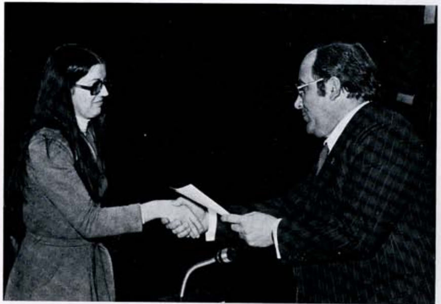
29 abril: Un momento de la entrega de premios "Bernardino de Sahagún" para Trabajos Científicos, Tesis Doctorales y Tesinas.