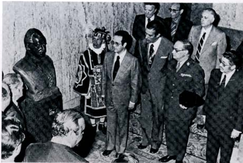
24 junio: Con asistencia del Gobernador Civil y otras autoridades, en el Ayuntamiento de León fue solemnemente instalado un busto del Rey.

La Diputación Provincial, en sesión plenaria, de carácter ordinario, acuerda aportar 140 millones de pesetas para el presupuesto Especial de Obras y Servicios. Son muchas las obras programadas y, todas, con un común denominador exacto, idéntico: mejorar el habitat rural.