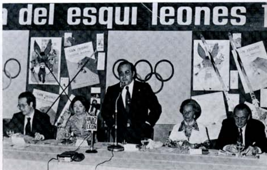
4 junio: Como cada año, se celebró la Gala del Esquí leonés, presidida por las primeras autoridades leonesas.

En la calle, también por entonces, la pregunta: "¿Será pronto realidad nuestra Universidad?". Y, una petición urgente: "Solicitar con carácter urgente la conversión de las secciones del Colegio Universitario de León en Facultades de Derecho y Filosofía y Letras".