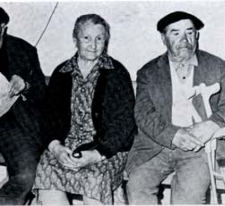
14 de junio, en Burón: pago de indemnizaciones a los afectados por el embalse de Riaño.