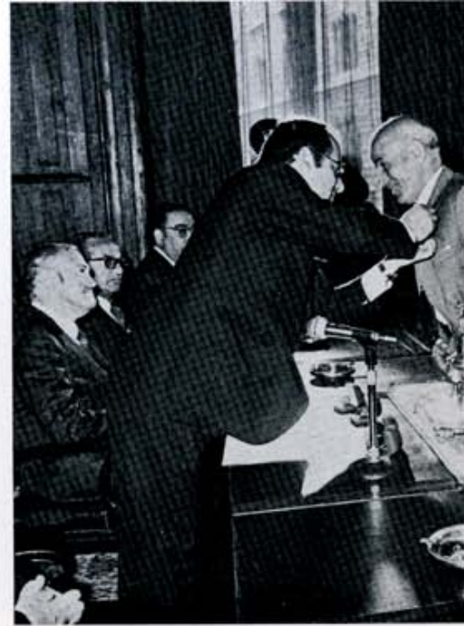
Imposición de distintivos a los funcionarios jubilados durante el homenaje que les tributó la Diputación el 17 de junio.

dente, con palabras emotivas, pondría de relieve la labor desarrollada por los hombres que ahora eran objeto del cariñoso homenaje de todos, los jubilados, "que no era otra cosa que hacer justicia —dijo— al premiar la conducta de unos funcionarios que, cada uno en su puesto, se habían entregado sin descanso a la tarea que les había sido señalada...".