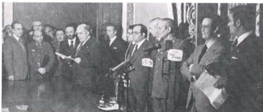
28 de enero: acto de relevo en el Gobierno Civil de la Provincia.

mercado de ganados. Alguien, por entonces, me dice: "El Ayuntamiento adeuda 70 millones a la empresa constructora". Y, asombroso, los partidos políticos empiezan a estudiar el Plan de Ordenación Urbana, quizás, sólo quizás, para planificar su marcha hacia los posibles escaños en el Senado y en el Congreso. Una buena urbanización es una buena urbanización. Hay que "alisar" caminos. Hay que "sonar".