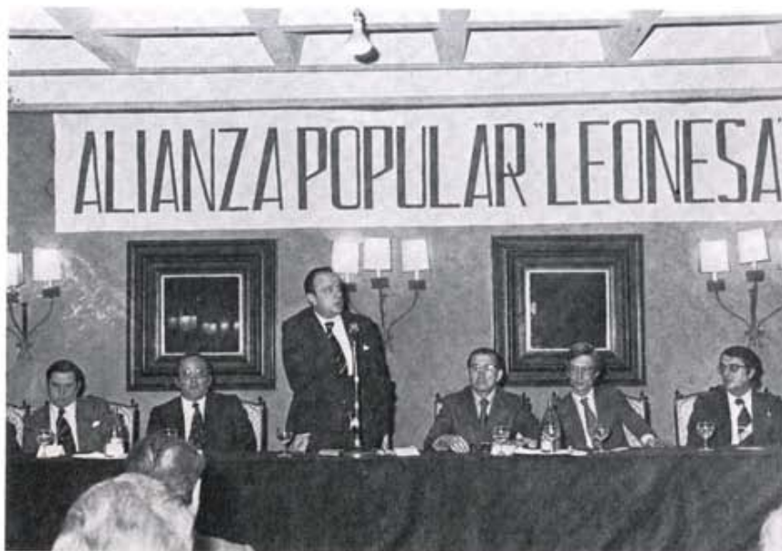
15 de febrero: presentación en León de Alianza Popular. Presidencia del acto y un aspecto del público asistente.