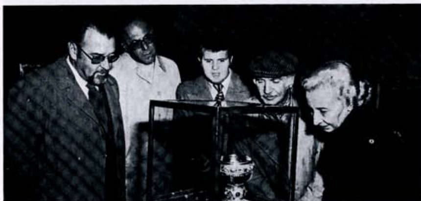
5 de febrero: el ministro de Relaciones Exteriores del Perú visitó León. En la fotografía: ante el Cáliz de Doña Urraca, en el Museo de la Basílica de San Isidoro.