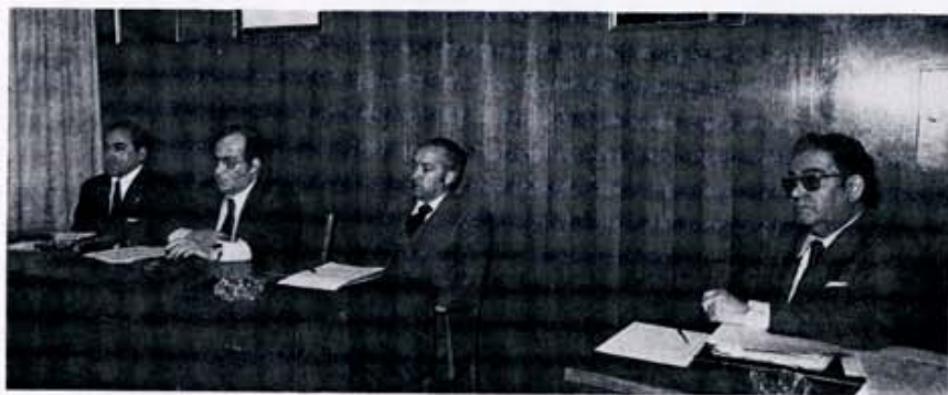
27 de enero: Presidencia de la Comisión de Gobierno de la Diputación, reunida en el Municipio de San Andrés del Rabanedo.

tiempo pasado, aparte de unos acontecimientos más o menos sobresalientes que marcaron la tónica de la vida provincial y local, ha existido una especie de común denominador generalizado y, éste, no fue otro que lo que se podía denominar etapa de precalentamiento político con vistas a las elecciones del 15 de junio.