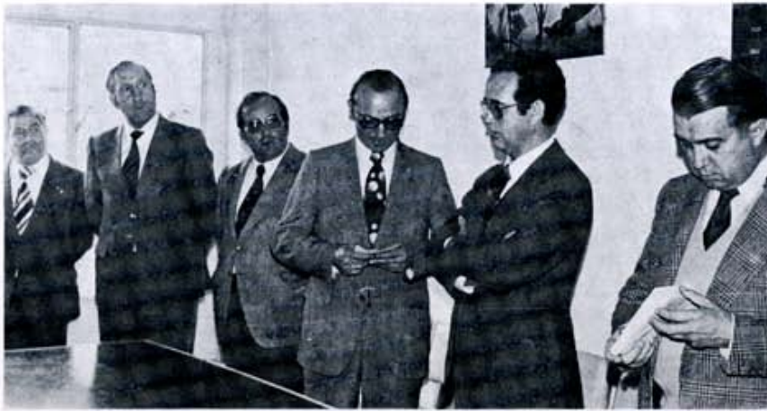
De las visitas del Gobernador Civil a la Provincia: Sahagún.