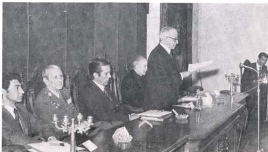
Acto inaugural del Congreso Luso-Español para el Progreso de las Ciencias, el 28 de marzo.