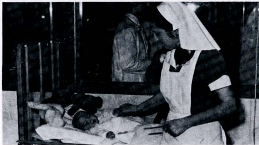
El niño portugués abandonado, atendido en el Hospital "Princesa Sofía".