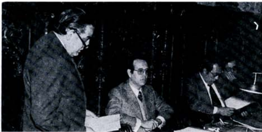
El Gobernador Civil en el Ayuntamiento de Astorga.