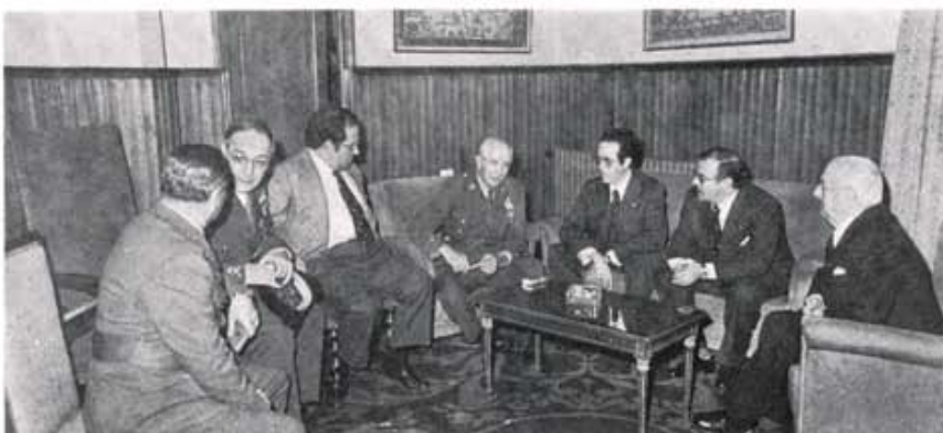
3 de marzo: el Capitán General de la Región en León.