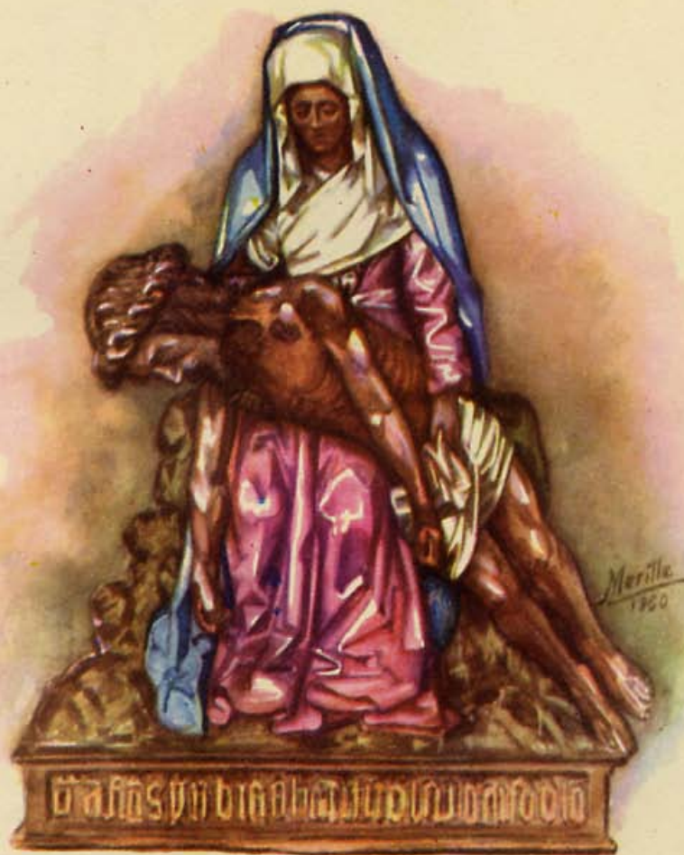
Nuestra Señora y Madre la Virgen del Camino, imán del pueblo leonés, Patrona Excelsa de las Tierras de León.